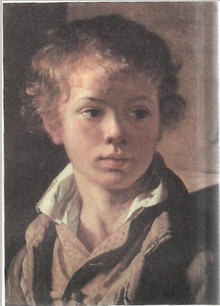
В. Тропинин. Портрет Арсения — сына художника