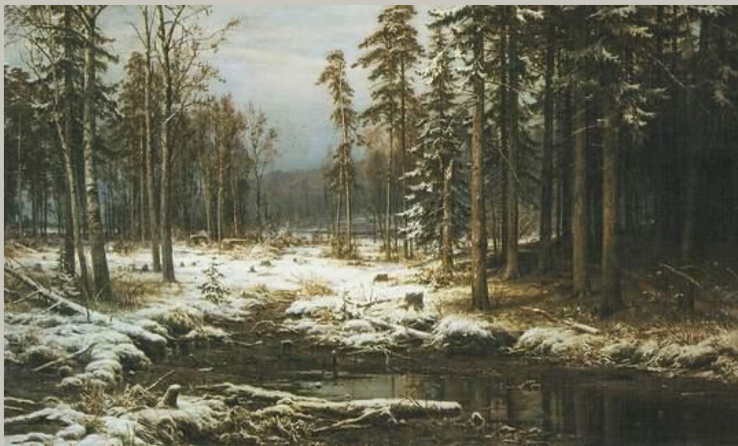
Первый снег. 1875 ШИШКИН

Французское слово «пейзаж» означает «природа». Она становится как бы «героем» произведения