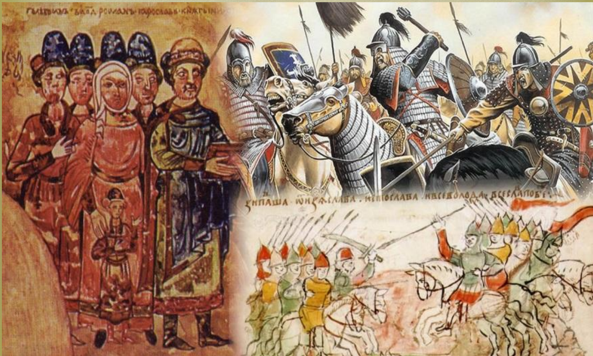
Виконав студент групи ПМ-15-1 Голуб Андрій