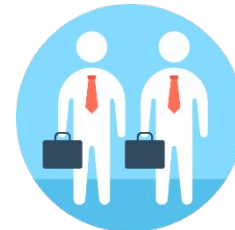
Третьи лица (реестродержатель, приобретатели акций, Банк России)