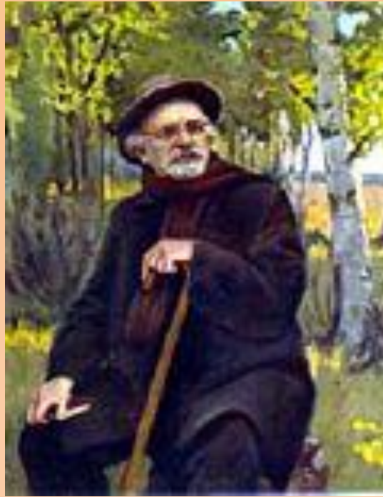
Михаил Михайлович Пришвин (1873 – 1954)