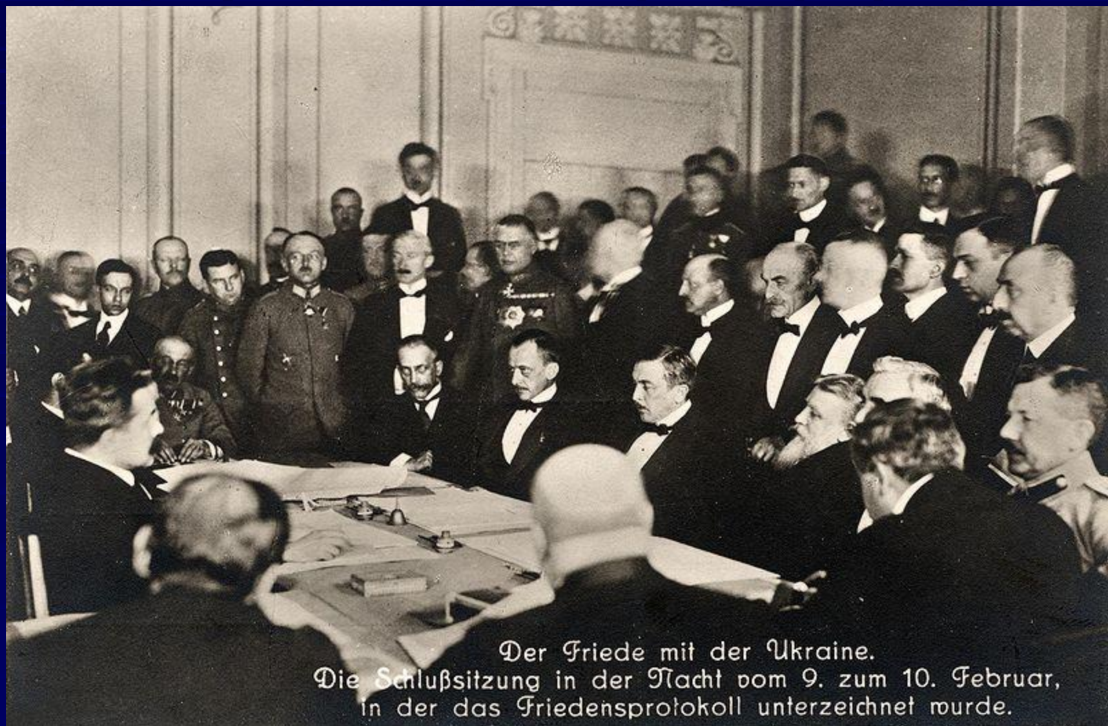
Der Friede mit der Ukraine. Die Schlußsitzung in der Nacht vom 9. zum 10. Februar, in der das Friedensprotokoll unterzeichnet wurde.