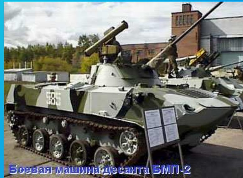
Боевая машина десанта БМП-2