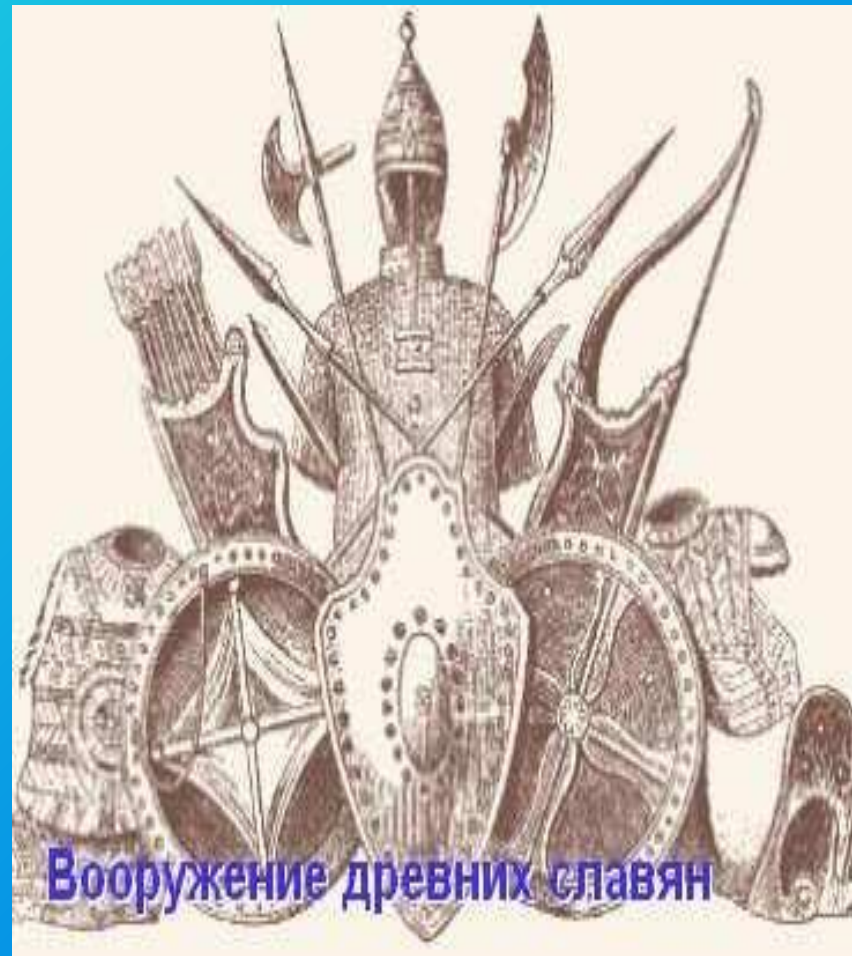
Вооружение древних славян