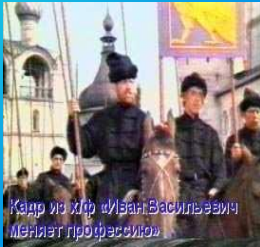
Кадр из к/ф «Иван Васильевич меняет профессию»