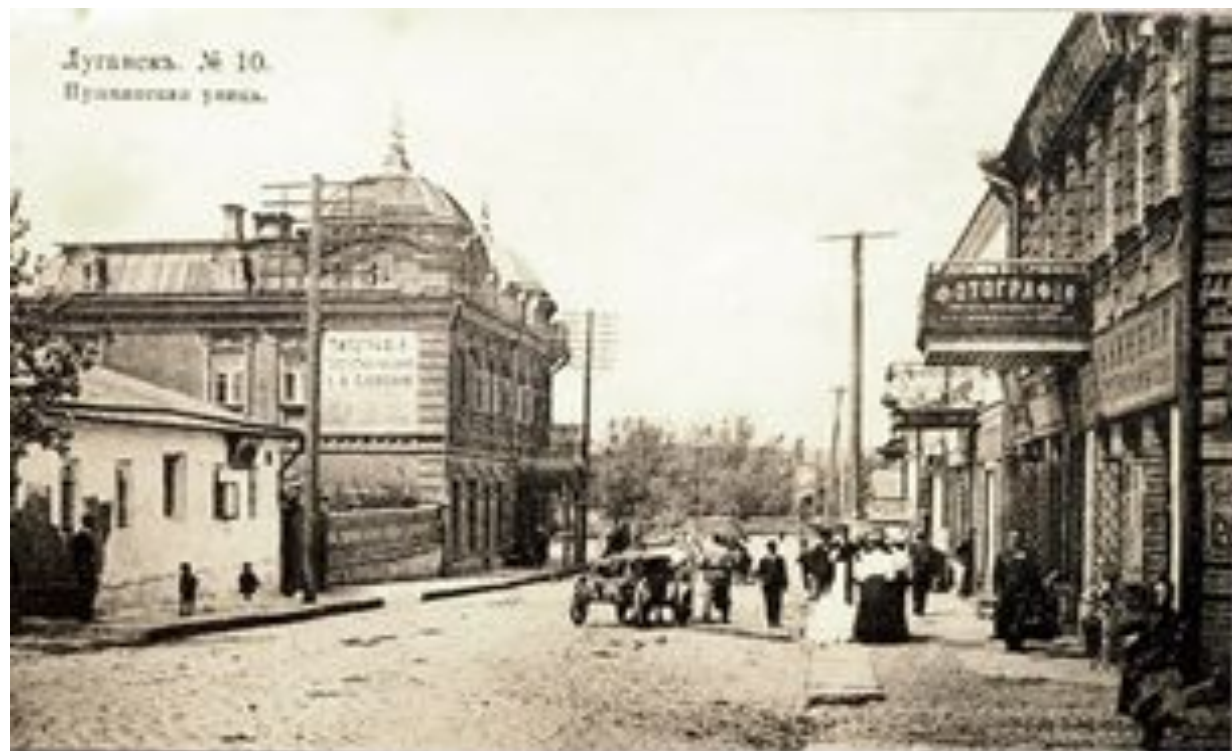
Луганск. Пушкинская улица.