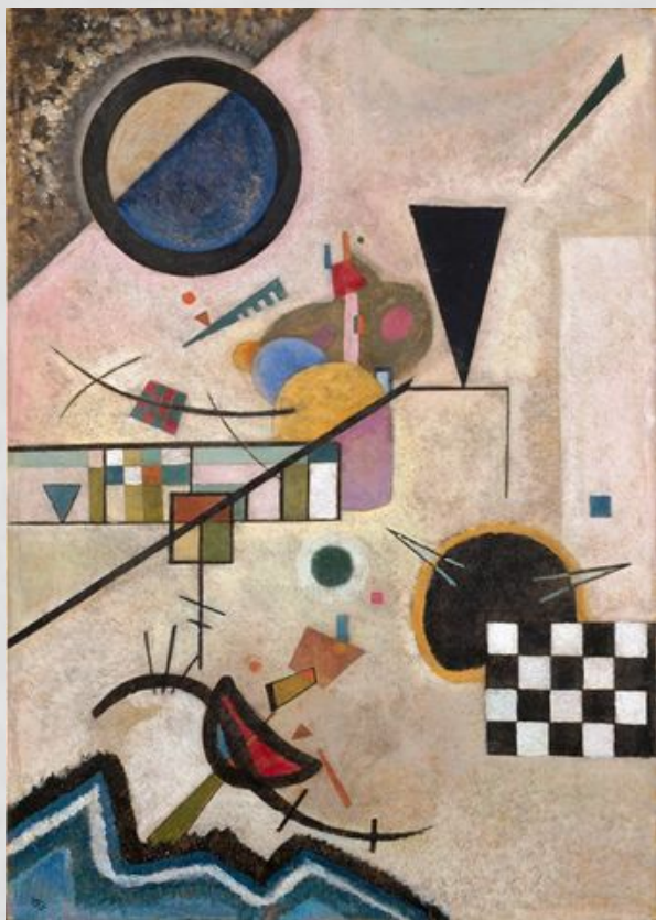
В. Кандинский «Контрастные звуки»