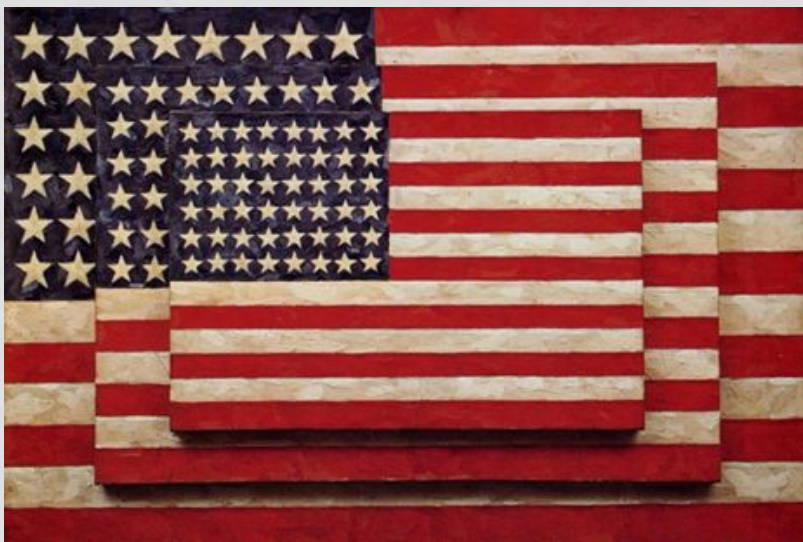
Джаспер Джонс «Три флага»