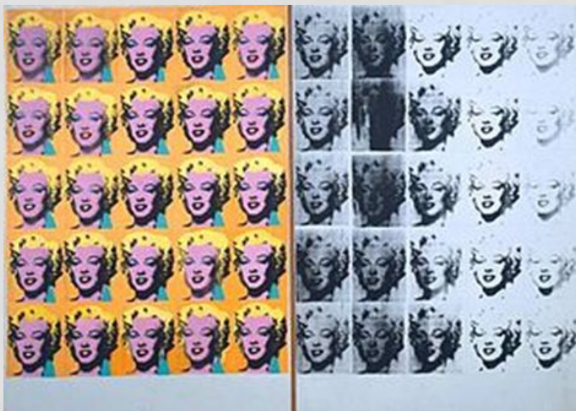
Энди Уорхол «Диптих Мэрилин»