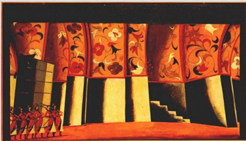
В. Татлин «Спасские ворота»