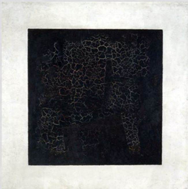
К. Малевич «Черный квадрат»