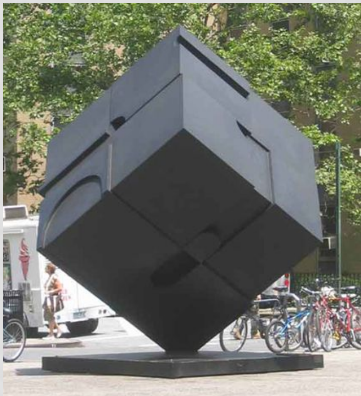
Скульптура "Аламо" Скульптор: Тони Розенталь