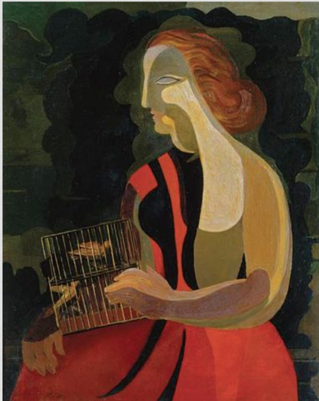
А. Экстер «Woman with birds»