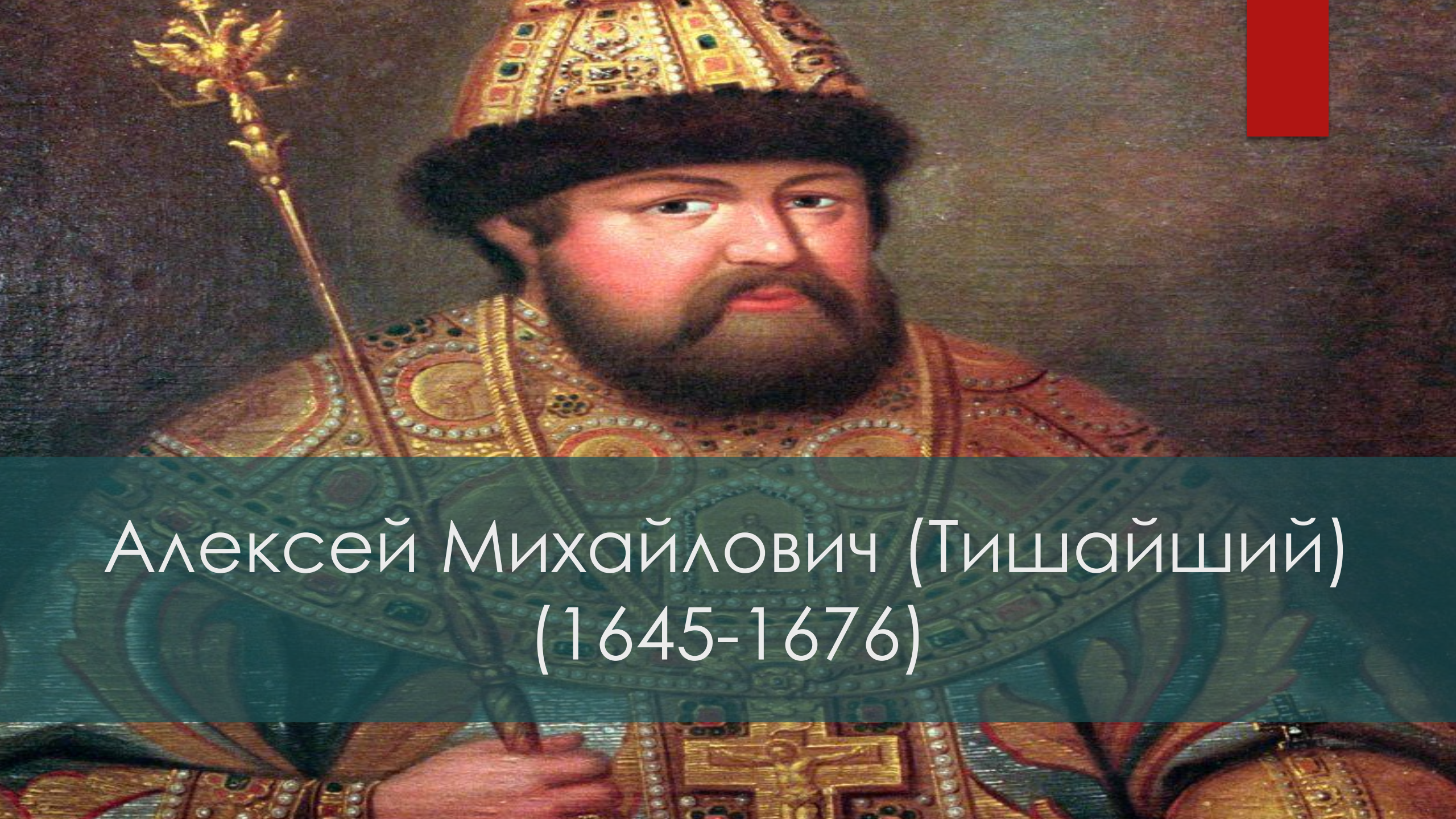
Алексей Михайлович (Тишайший) (1645-1676)