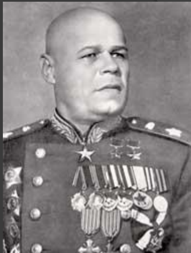
Павел Семёнович Рыбалко – Маршал Советского Союза