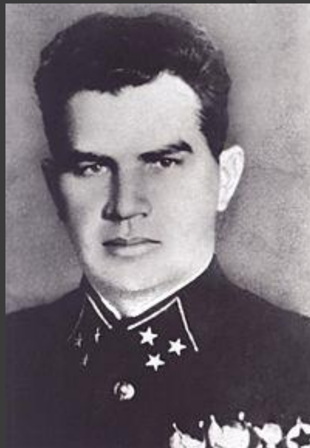
Василий Иванович Чуйков