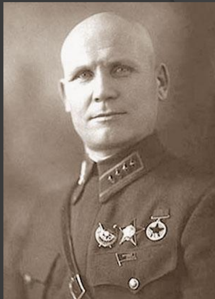
Иван Степанович Конев – генерал армии