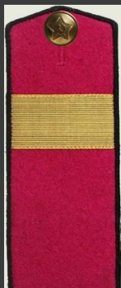
Старший сержант , пехота, повседневная форма