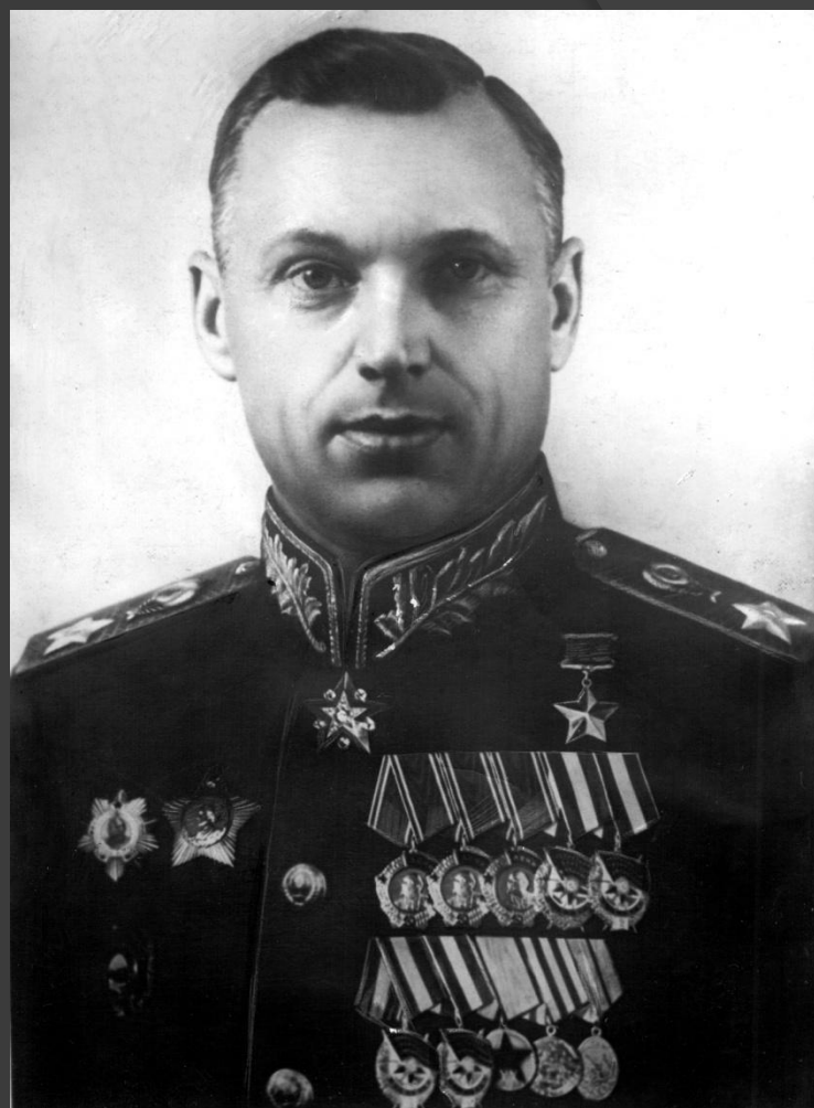
Константин Константинович Рокоссовский - Маршал Советского Союза