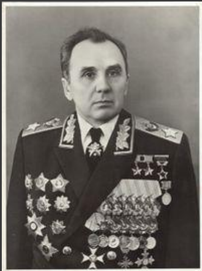
Кирилл Семёнович Москаленко - Маршал Советского Союза