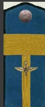
Старшина авиации , повседневная форма