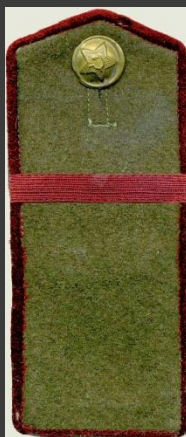
Ефрейтор , пехота, полевая форма