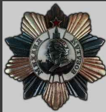
ОРДЕН КУТУЗОВА II степени