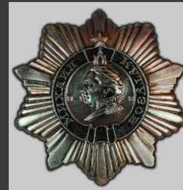
ОРДЕН КУТУЗОВА III степени

Дата учреждения: 29 июля 1942 года Первое награждение: 28 января 1943 года