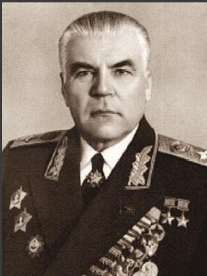
Родион Яковлевич Малиновский - Маршал Советского Союза