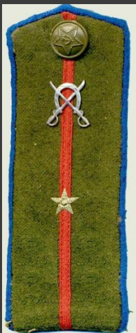
Младший лейтенант (кавалерия)