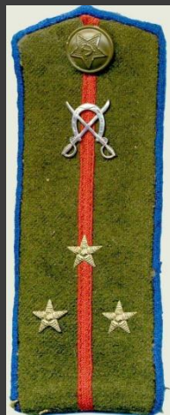
Старший лейтенант (кавалерия)