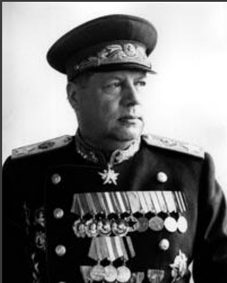
Федор Иванович Толбухин - маршал Советского Союза