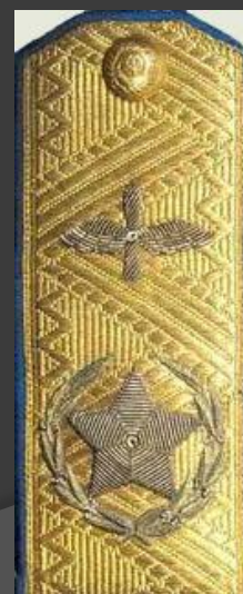
Главный Маршал авиации