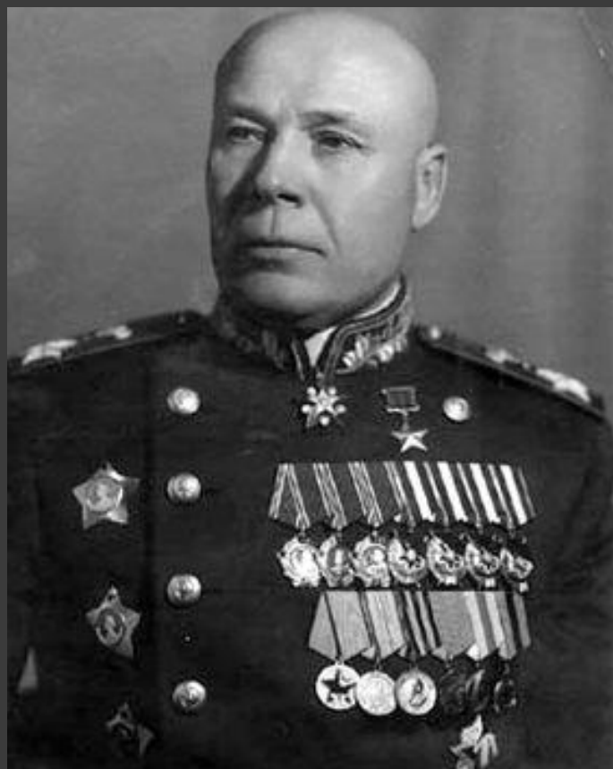
Семён Константинович Тимошенко Маршал Советского Союза