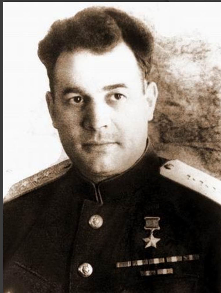
Черняховский Иван Данилович - генерал-лейтенант, командующий 60-й армией, войсками Западного фронта