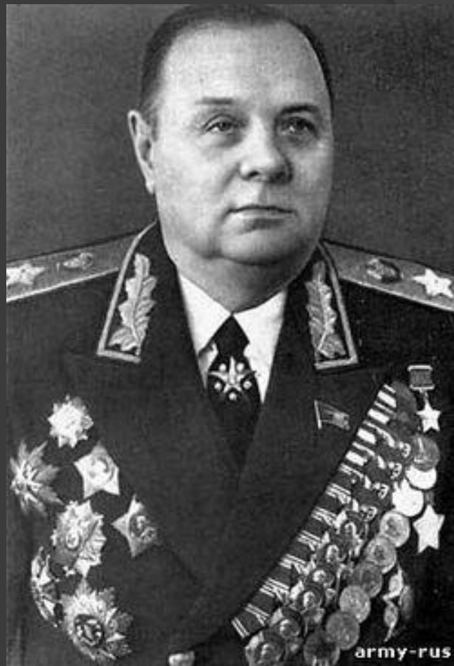
Кирилл Афанасьевич Мерецков - Маршал Советского Союза