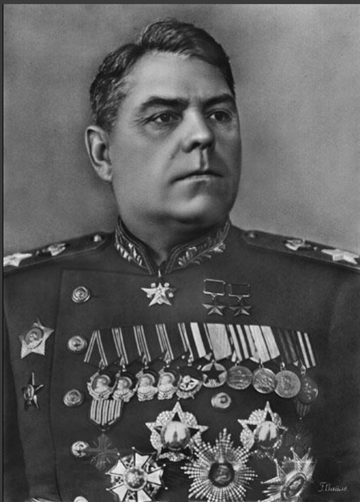
Александр Михайлович Василевский – Маршал Советского Союза