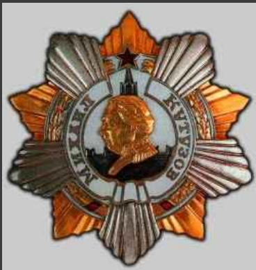
ОРДЕН КУТУЗОВА I степени

Согласно статуту орденом награждались офицеры Красной Армии (откомандира дивизии до командира взвода) за проявленную инициативу по выбору удачного момента для внезапного, смелого и успешного нападения на врага и нанесение ему крупного поражения с малыми потерями для своих войск; за успешное выполнение боевого задания с уничтожением полностью или большей части превосходящих сил противника; за командование артиллерийским, танковым или авиационным подразделением, нанесшим тяжелый урон противнику.