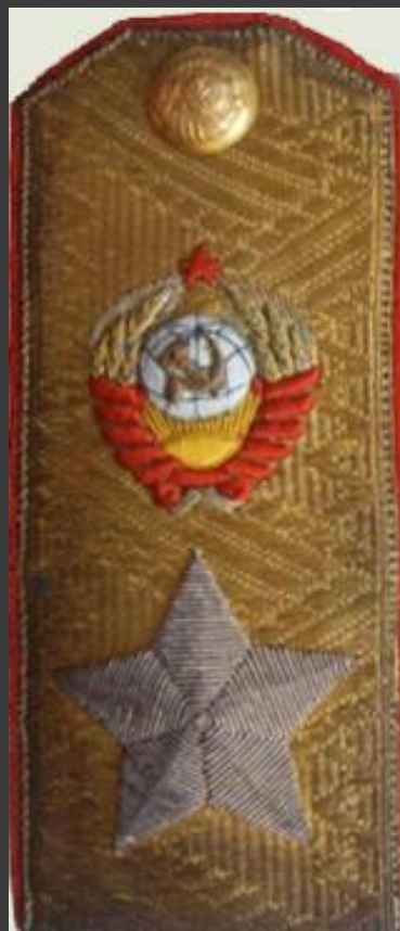
Маршал Советского Союза (погон Кирилла Афанасьевича Мерецкова)