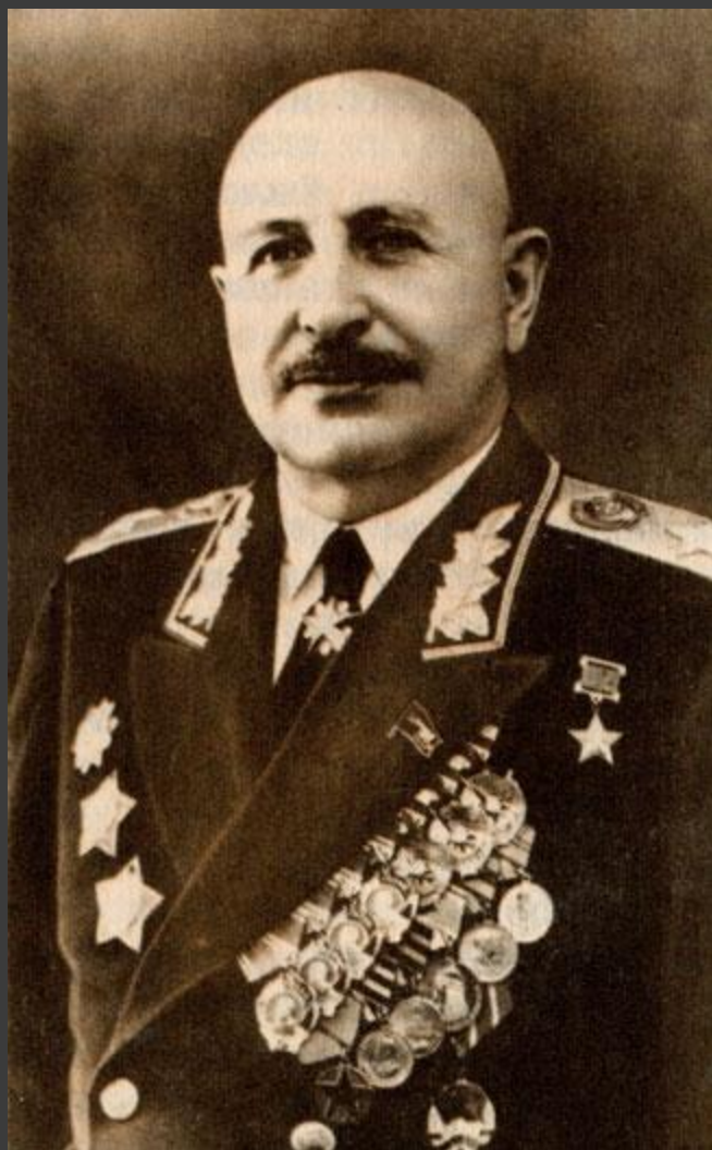
Иван Христофорович Баграмян - Маршал Советского Союза