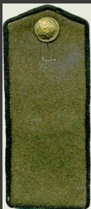
Рядовой , технических родов войск, полевая форма