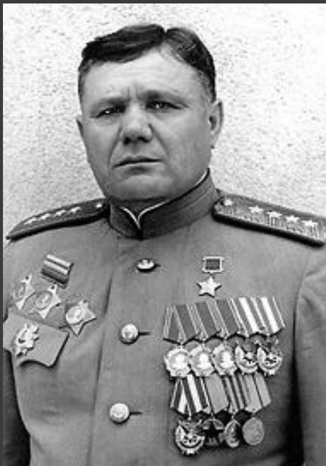
Андрей Иванович Еременко – генерал армии