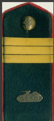
Сержант , бронетанковых войск, повседневная форма