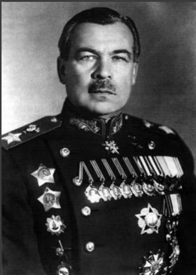
Леонид Александрович Говоров - Маршал Советского Союза