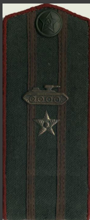
Майор (бронетанковые войска)