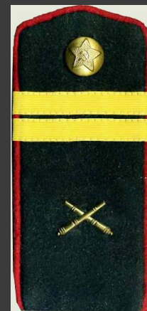
Младший сержант , артиллерия, повседневная форма