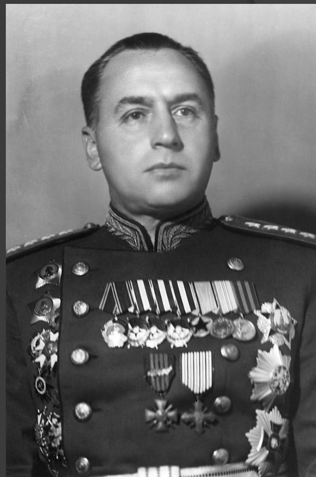
Алексей Иннокентьевич Антонов – генерал армии