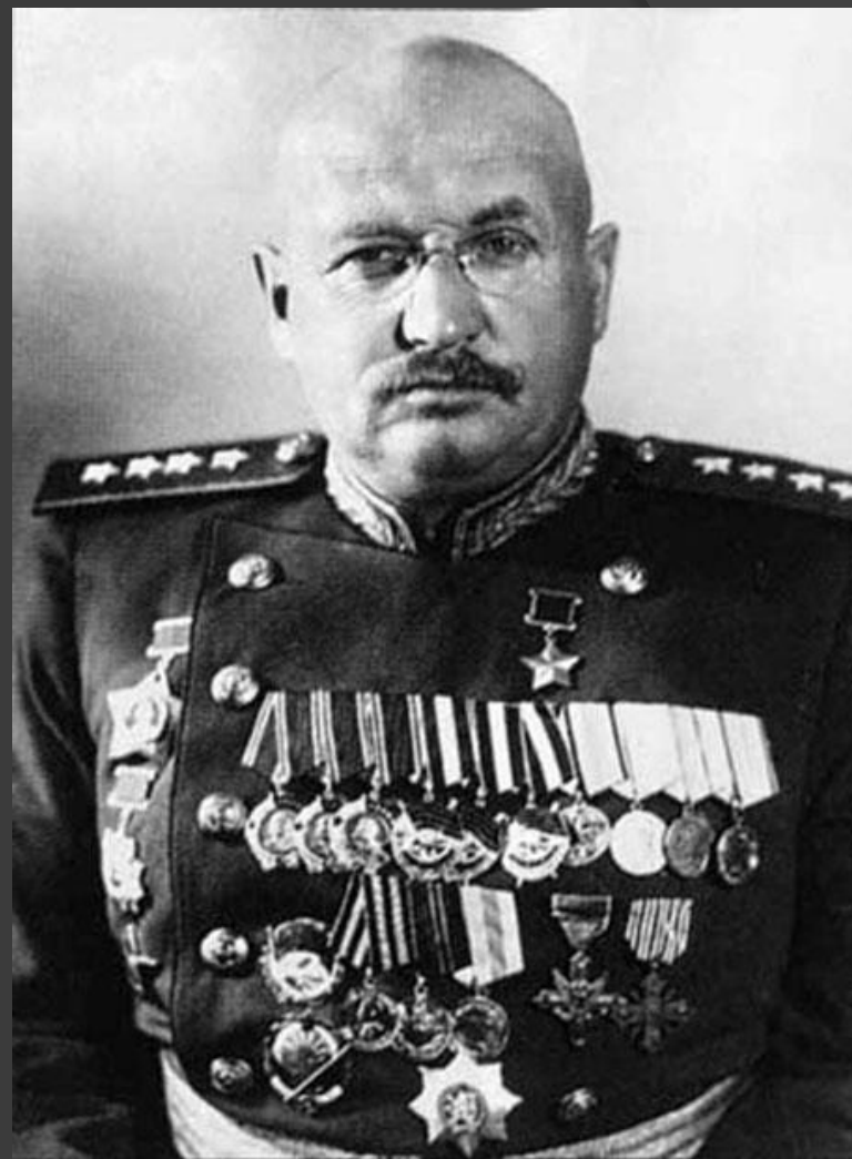
Иван Ефимович Петров - генерал армии.