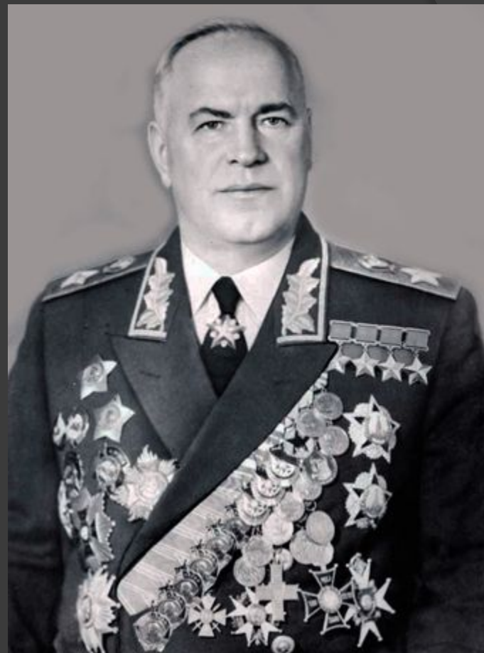
Жуков Георгий Константинович - первый заместитель наркома обороны СССР и заместитель Верховного главнокомандующего. Маршал Советского Союза