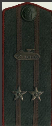
Подполковник (бронетанковые войска)