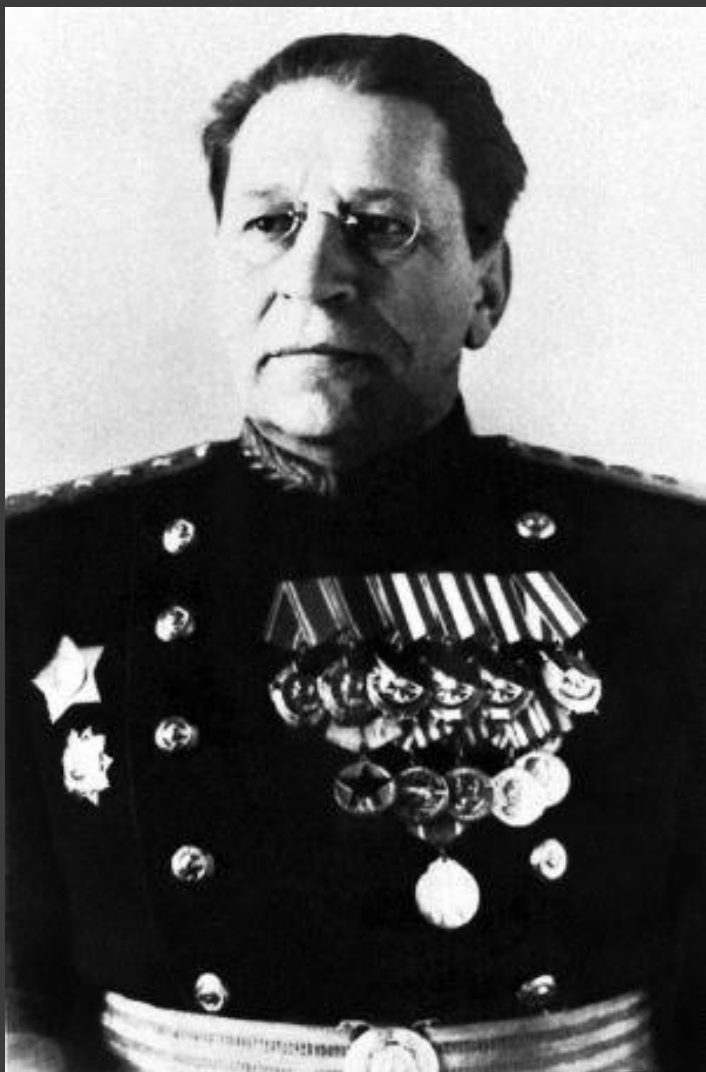
Пуркаев Максим Алексеевич - генерал армии.