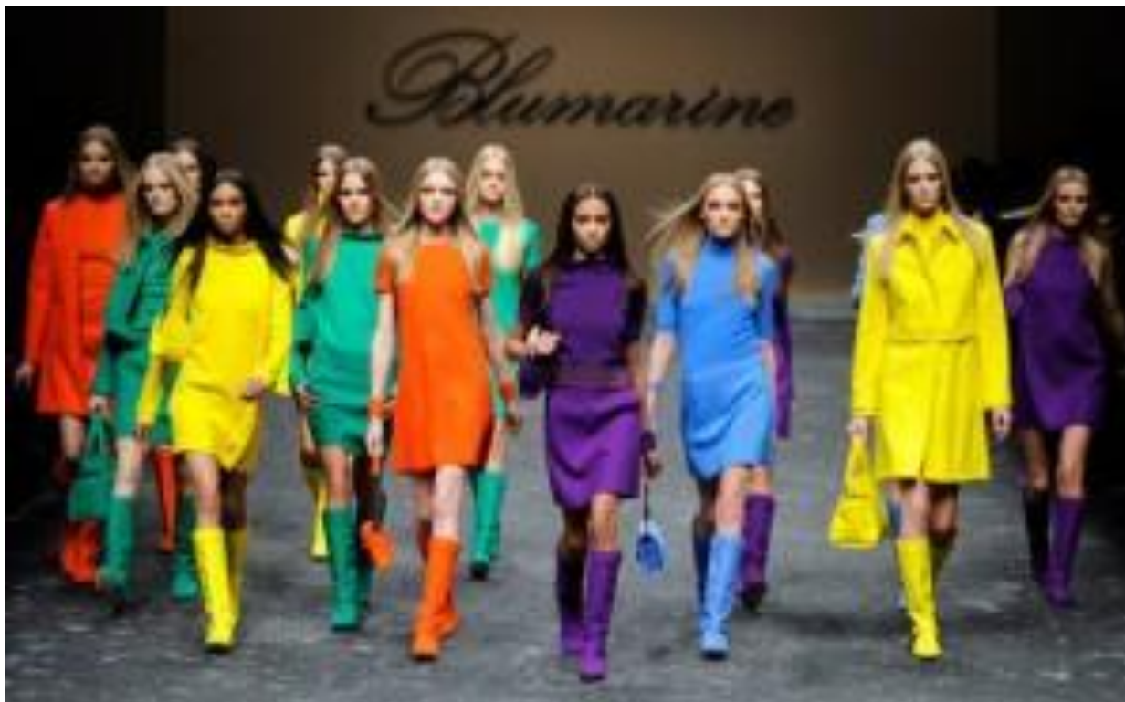
Коллекция осень - зима 2011-2012 от Blumarine