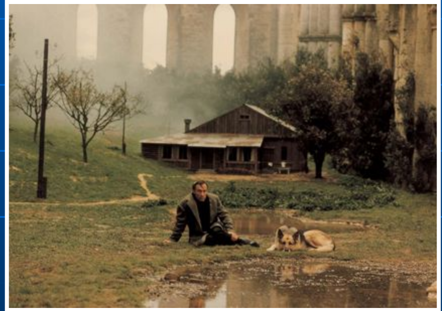
«Сталкер» Андрей Тарковский