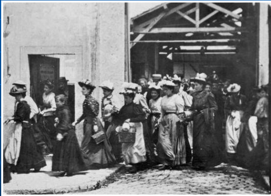
«Выход рабочих с завода Люмьер» 22 марта 1895 года

После появления фотографии для этого оставалось сделать лишь небольшой шаг: создать киноплёнку, съёмочную и проекционную киноаппаратуру и повесить экран.