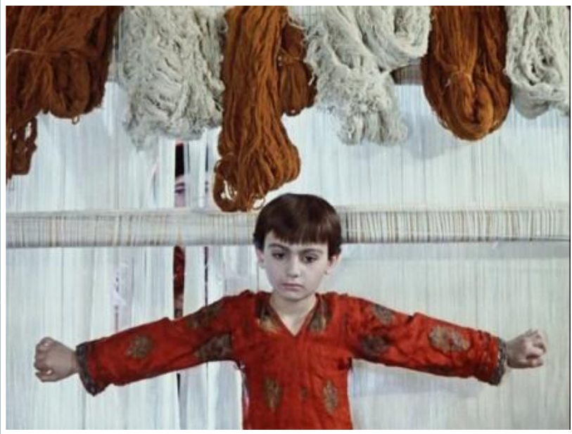
«Цвет граната» Сергей Параджанов

Цвет в кино возникает на экране без воли автора. Он копия, слепок природной реальности.