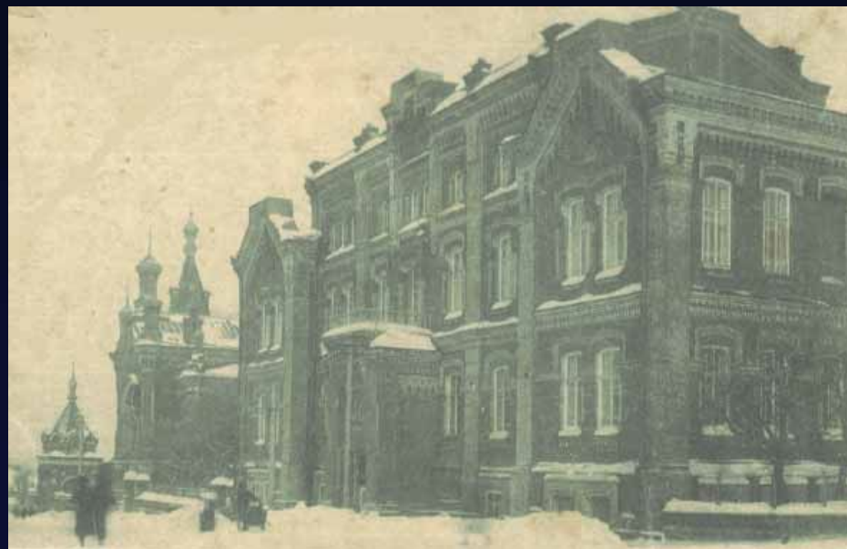
Пермская духовная семинария

Проучившись год, вынужден был оставить учёбу, из-за материальных трудностей и резкого ухудшения здоровья (начался туберкулез).