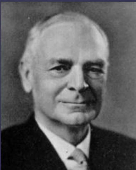
Джордж Хоманс (1910-1989)

Самой значительной бихевиористской школой о социологии является теория социального обмена. Наиболее яркими представителями теории социального обмена являются