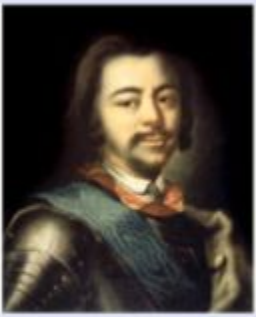
Петр I. Портрет работы И. Н. Никитина. Псковский историко-художественный музей-заповедник.

ПЕТР I ВЕЛИКИЙ [30 мая (9 июня) 1672, Москва — 28 января (8 февраля) 1725, Санкт-Петербург], российский царь с 1682 (правил с 1689), первый российский император (с 1721).