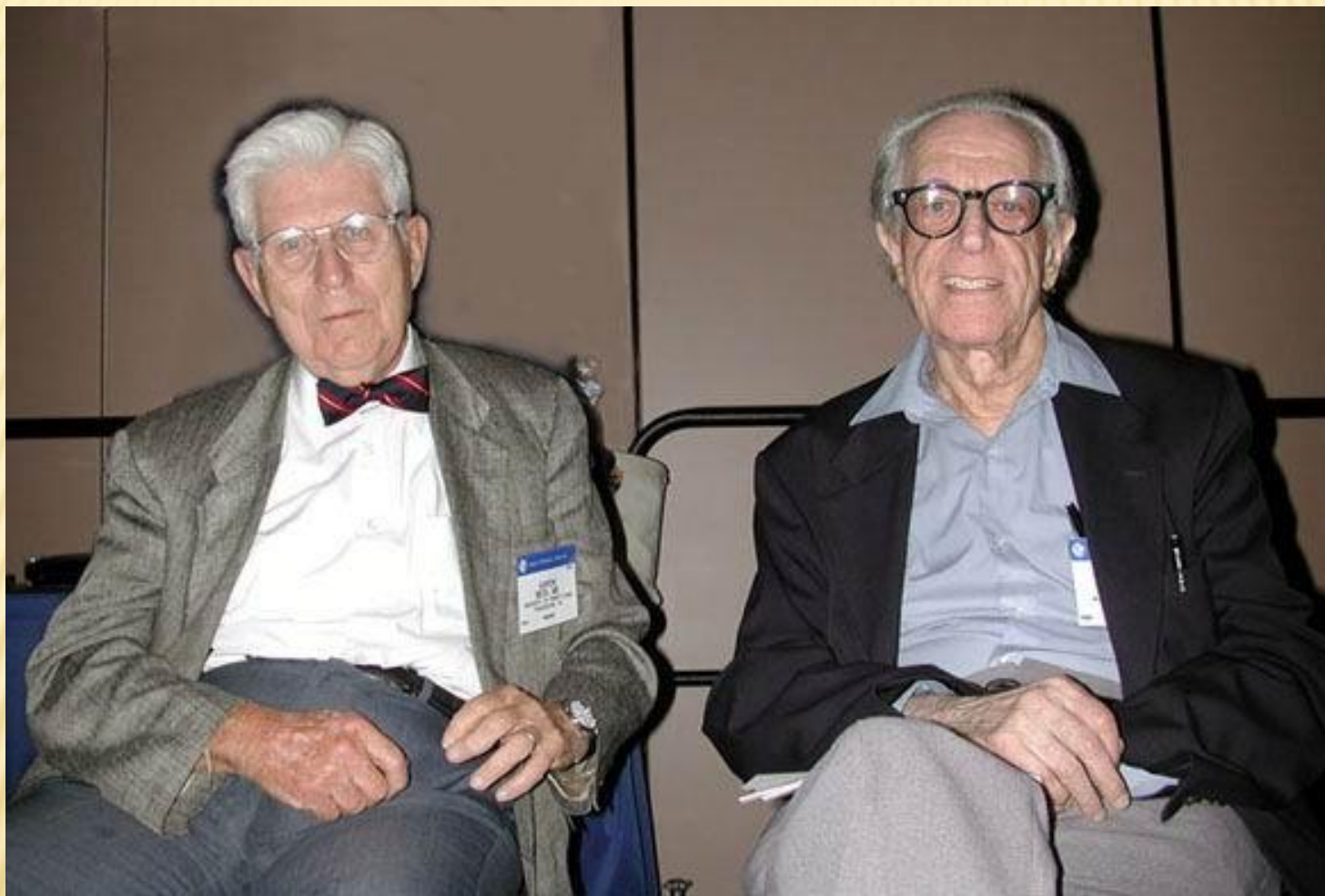
Аарон Бек (слева) и Альберт Эллис (справа) – легендарные психотерапевты, создатели когнитивной терапии