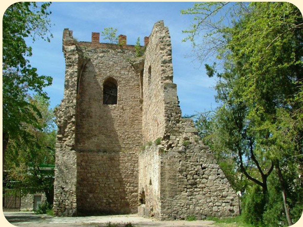
Башня в Феодосии