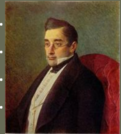
Александр Сергеевич ГРИБОЕДОВ