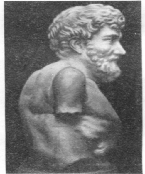
Эзоп — горбатый мудрец. Мрамор. VI в. до н. э. Вилла Альбани.

Легендарный баснописец Эзоп, живший в Древней Греции еще в 440 году до н.э. предложил делать это в другой форме. По его словам, вовсе не нужно в скучной тираде описывать человеческие пороки и поступки, а достаточно изобразить их в коротком живом рассказе – прозаическом или стихотворном - басне.