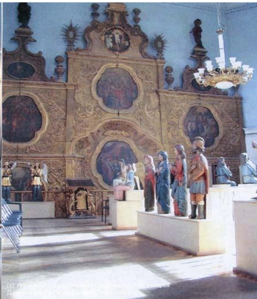
(с) Византизм (судетський) і ренесансний галерея Державний історико-художній музей Львова