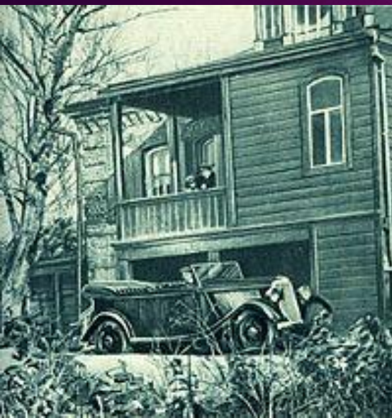
Вход в дом И. В. Мичурина