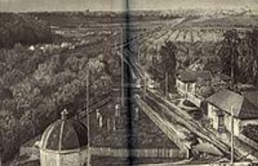
Репродукционное отделение центральной генетической плодово-ягодной лаборатории имени И. В. Мичурина