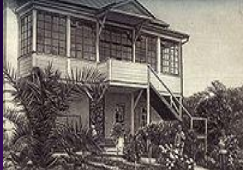
Здание электробиологической и физиологической лабораторий (репродукционное отделение Центральной генетической плодово-ягодной лаборатории имени И. В. Мичурина)