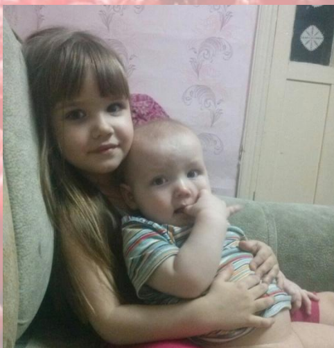
Присматривает за младшими