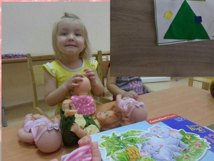
Играет с друзьями