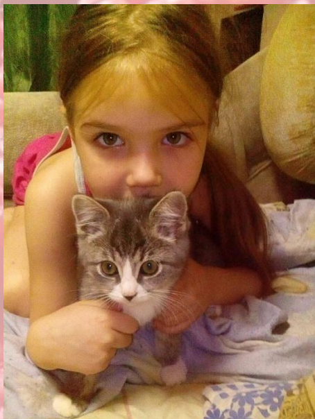
Играет с животными