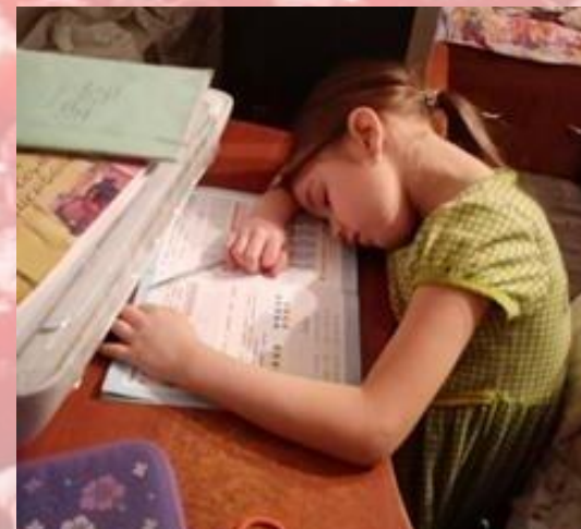
А вот с уроками бывает по-разному...