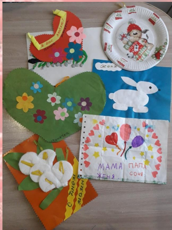
Творит и вытворяет