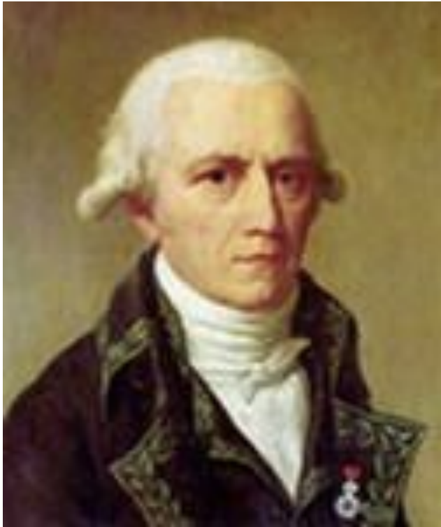
Ж. Б. Ламарк