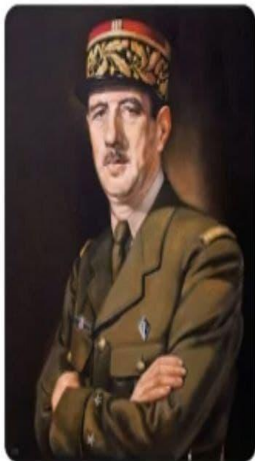
Шарль де Голль (1890-1970)

Шарль де Голль – великий сын французского народа, Спаситель Франции.