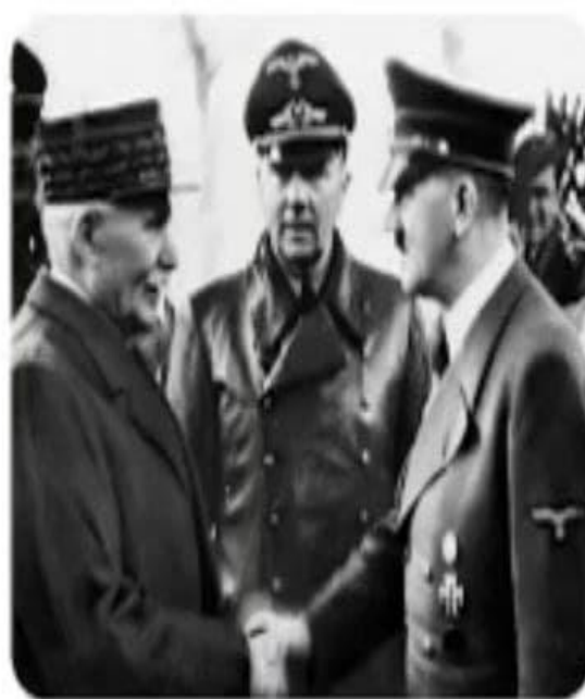
Глава французского правительства маршал Петэн приветствует А.Гитлера в Париже

22 июня 1940 года было подписано франко-германское перемирие. По условиям, французские армия и флот разоружались и демобилизовывались. Франция должна была выплачивать огромные контрибуционные платежи. Две трети страны, включая Париж, оккупировались Германией, лишь её южная часть (свободная зона) и колонии оставались под контролем правительства Петэна.