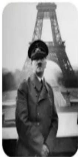
А. Гитлер позирует на фоне Эйфелевой башни