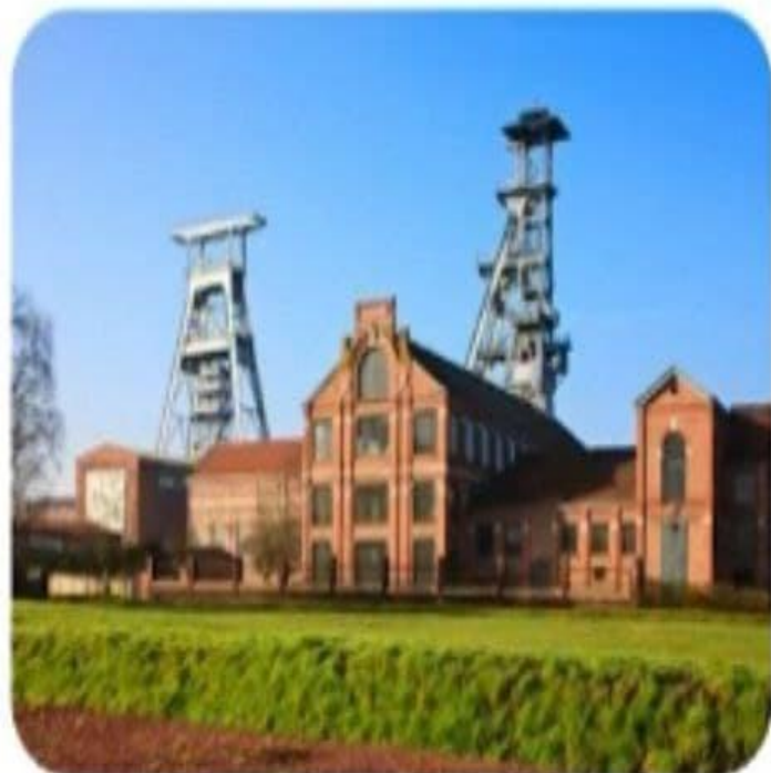
Угольные шахты Франции

Основа конституционной программы Шарля де Голля - идея «сильного государства», способного обеспечить величие Франции, национальную независимость и единство.