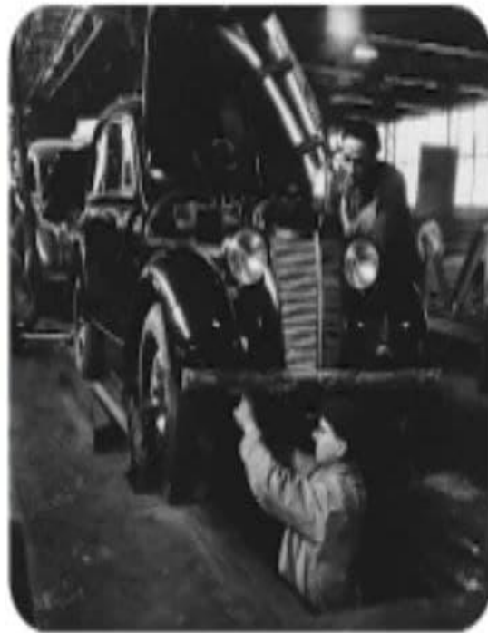
Заводы автомобильной компании