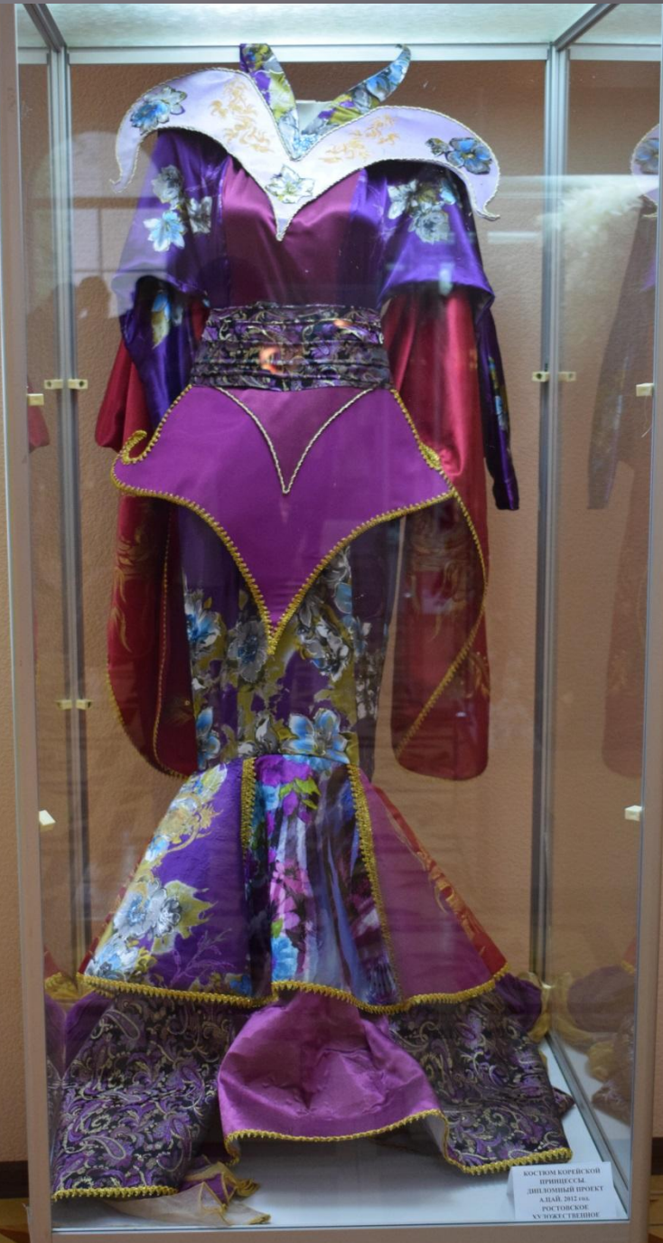
КОСТЮМ КОРТЕВСКОЙ ПРИНЦЕССЫ. ДИПЛОМАТИЧЕСКИЙ ПРОЕКТ АДМ. ЦЕНТРА РОСТОВСКОЕ XX ИСКУССТВО