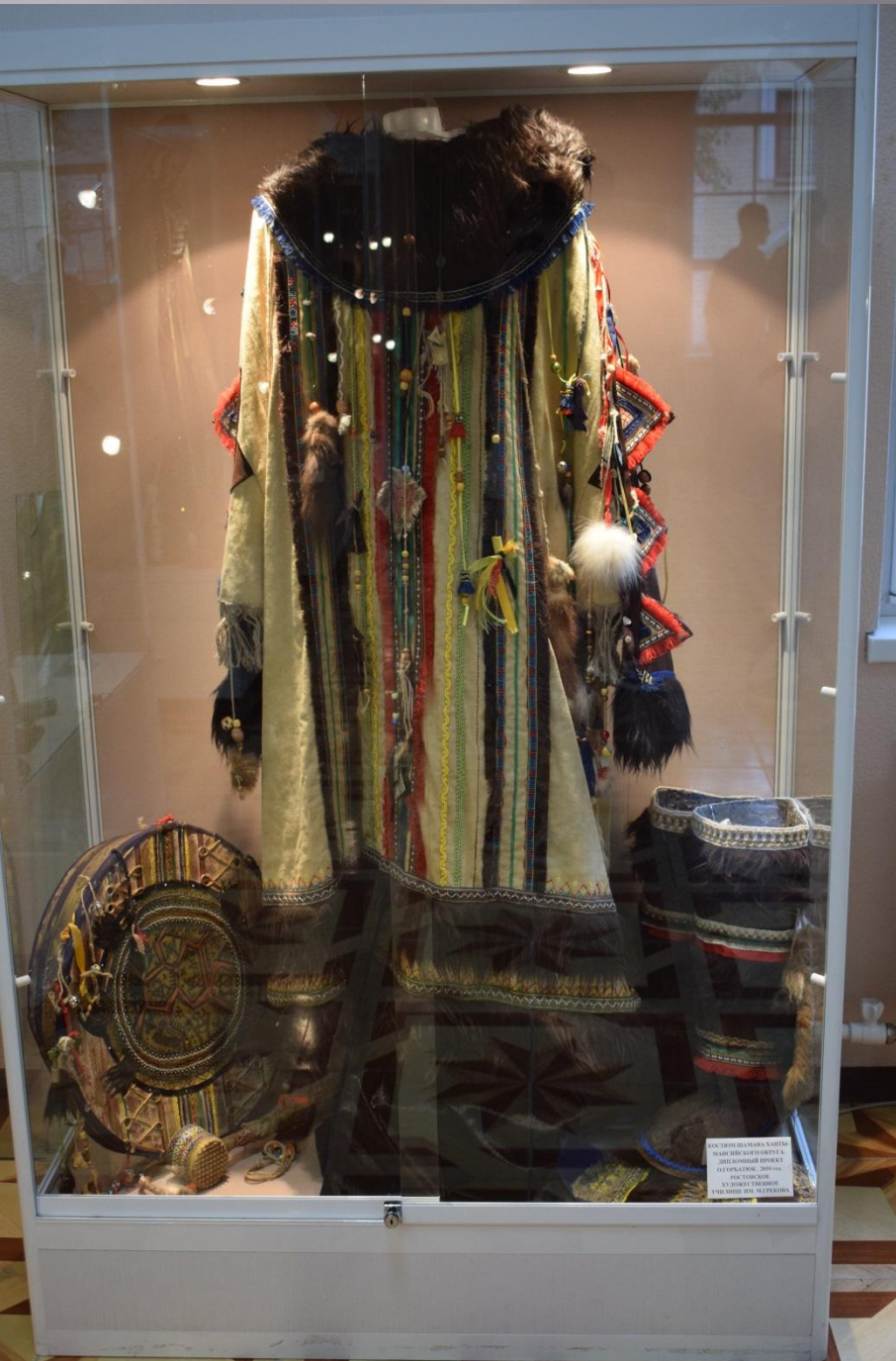
КОСТЮМ НАМАНКА ХАТТЫ НАМАНКА НАХОДИТСЯ В ДИПЛОМАТИЧЕСКОМ ПРОЕКТЕ В РОСТОВСКОМ ЦЕНТРЕ РОСТОВСКОЕ XX ДОПОЛНИТЕЛЬНЫЕ УЧЕБНЫЕ ПОСРЕДСТВА