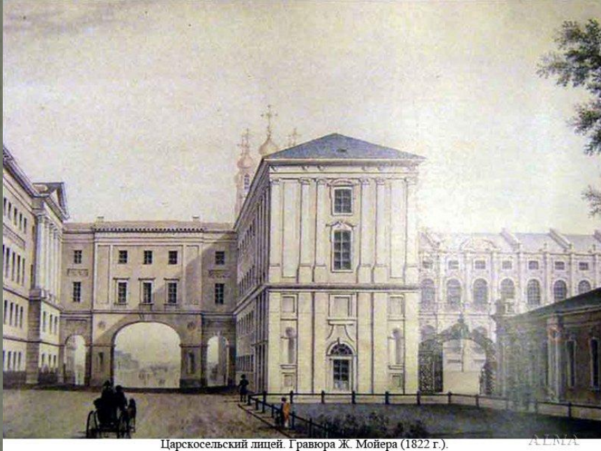
Царскосельский лицей. Гравюра Ж. Мойера (1822 г.).