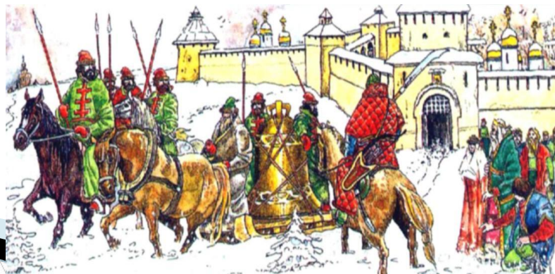
Вечевой колокол увозят из Новгорода