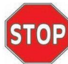
Стоп потрібно зупинитися і пропустити всі інші транспортні засоби

Дорожні знаки, що забороняють рух велосипедисту