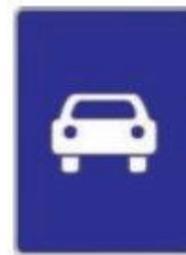
Дорога для автомобілів