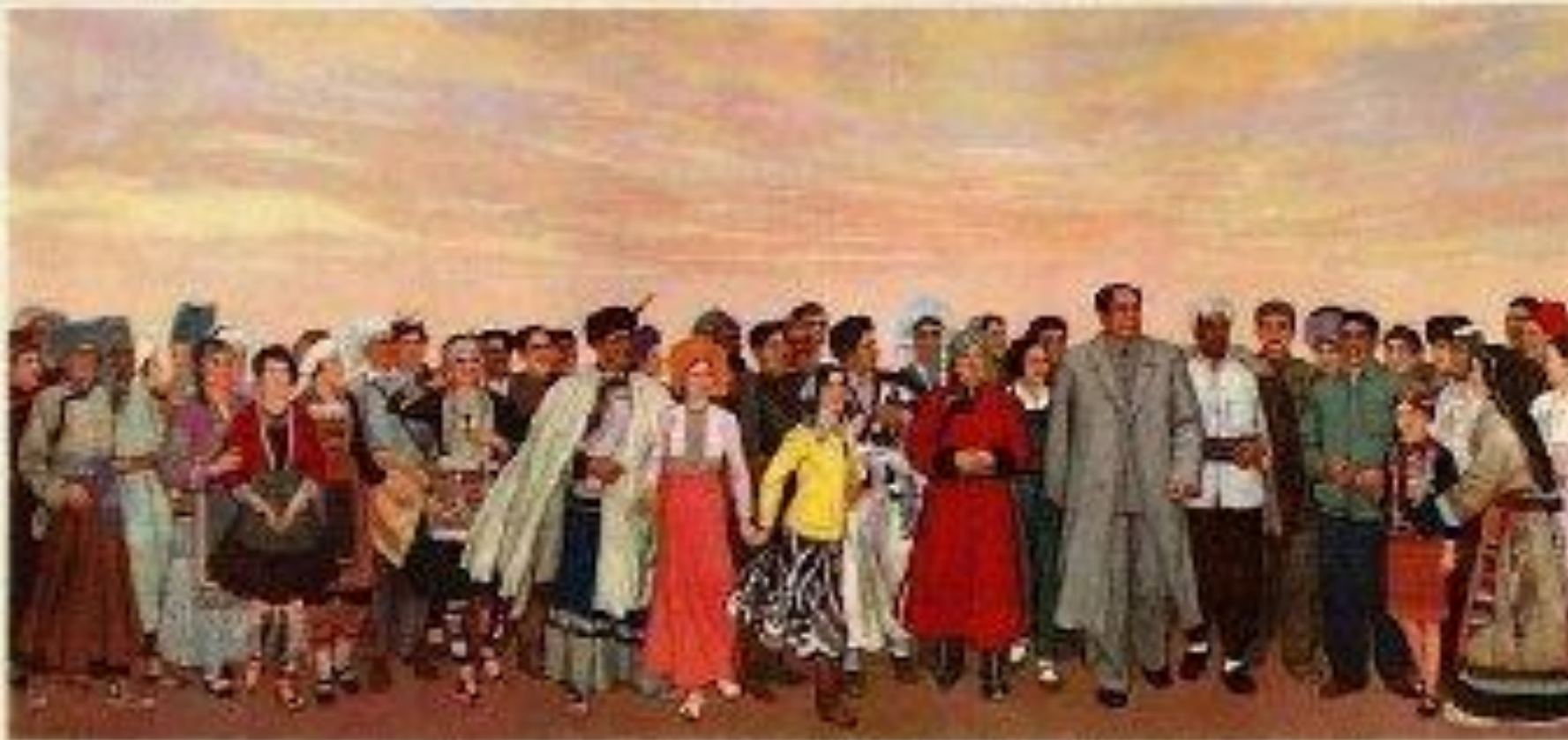
永远跟着共产党 永远跟着毛主席