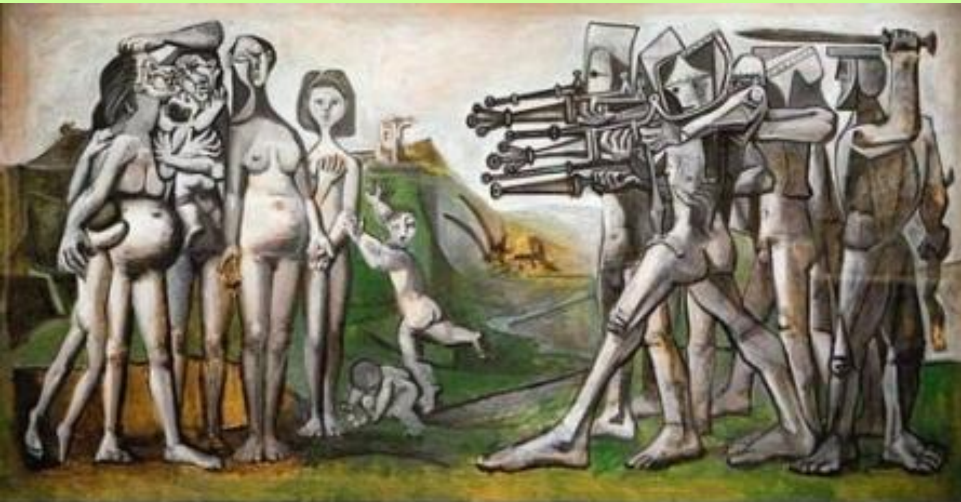
Пабло Пикассо. Бойня в Корее. 1951