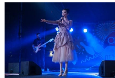
Выступление Сати Казановой

Мы серьезно и со всей ответственностью подходим к каждому проводимому нами мероприятию.