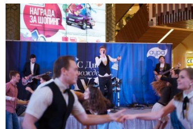
Выступление группы Partyphonix