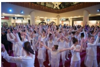
Массовый танцевальный флешмоб