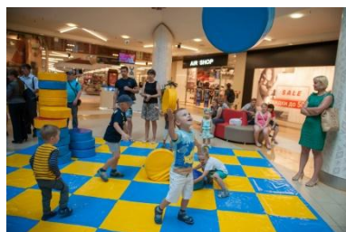
Детская игровая площадка