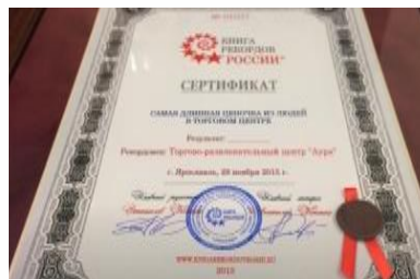
Установление рекорда России