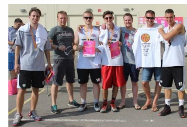
AURA CUP 2016

Мы серьезно и со всей ответственностью подходим к каждому проводимому нами мероприятию.