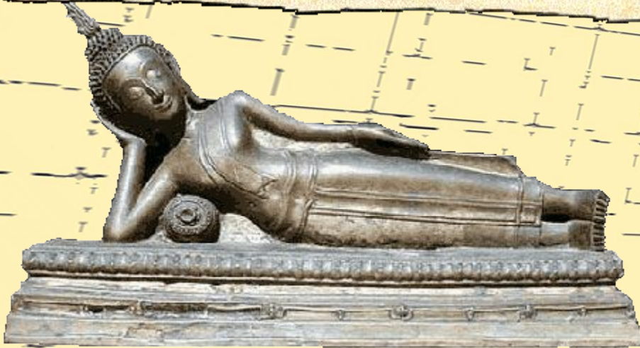
Будда. Кон. III-II вв. до н.э.

ГЛАВНОЕ — ЛИЧНОЕ ДОСТОИНСТВО ЧЕЛОВЕКА, А НЕ ЕГО ПРОИСХОЖДЕНИЕ.