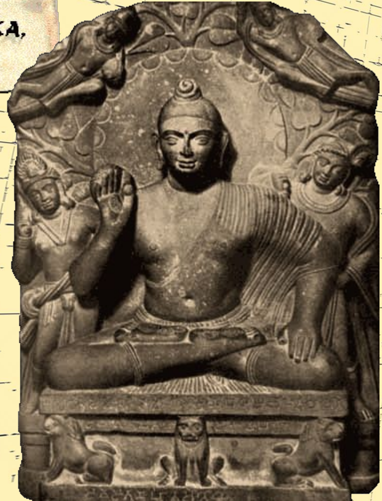
Будда на постаменте со львами