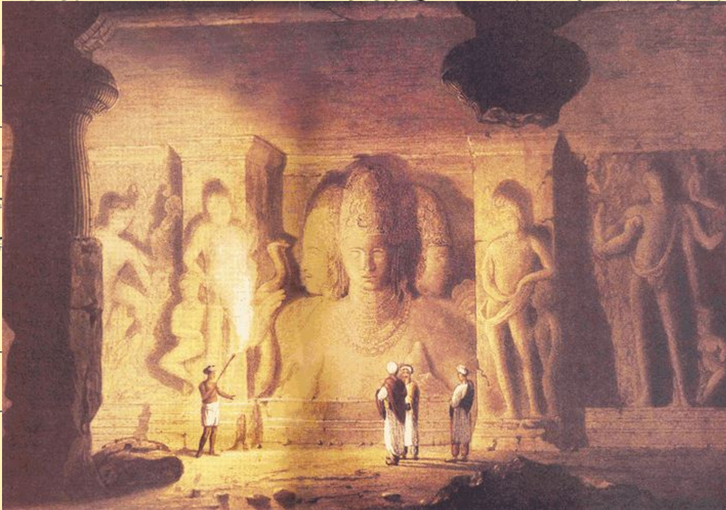
Храм в скалах о. Элефанта (VI в. до н.э.)