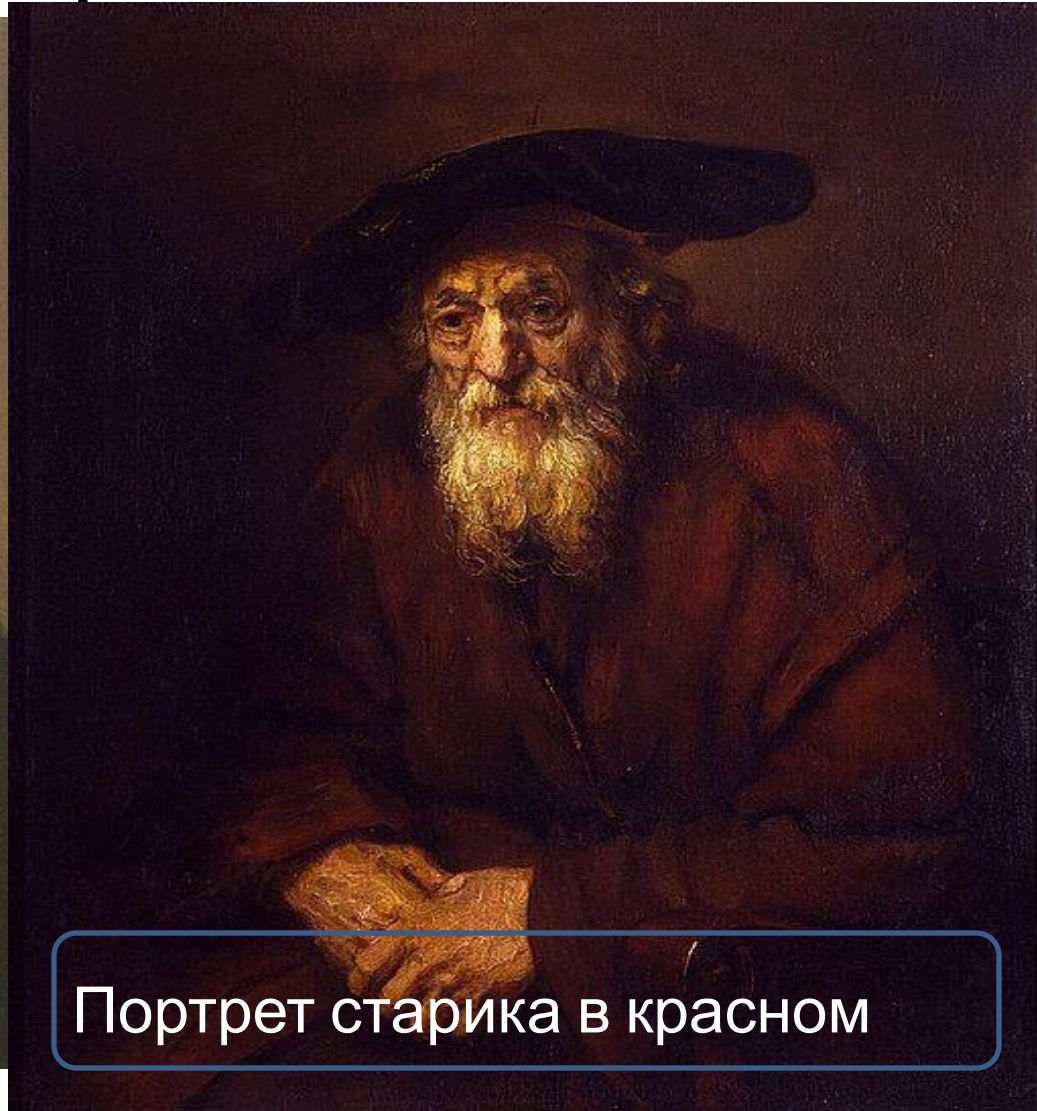
Портрет старика в красном