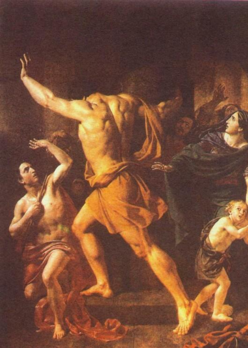
Ф.Завьялов. Самсон разрушает храм филистимлян. 1836г.