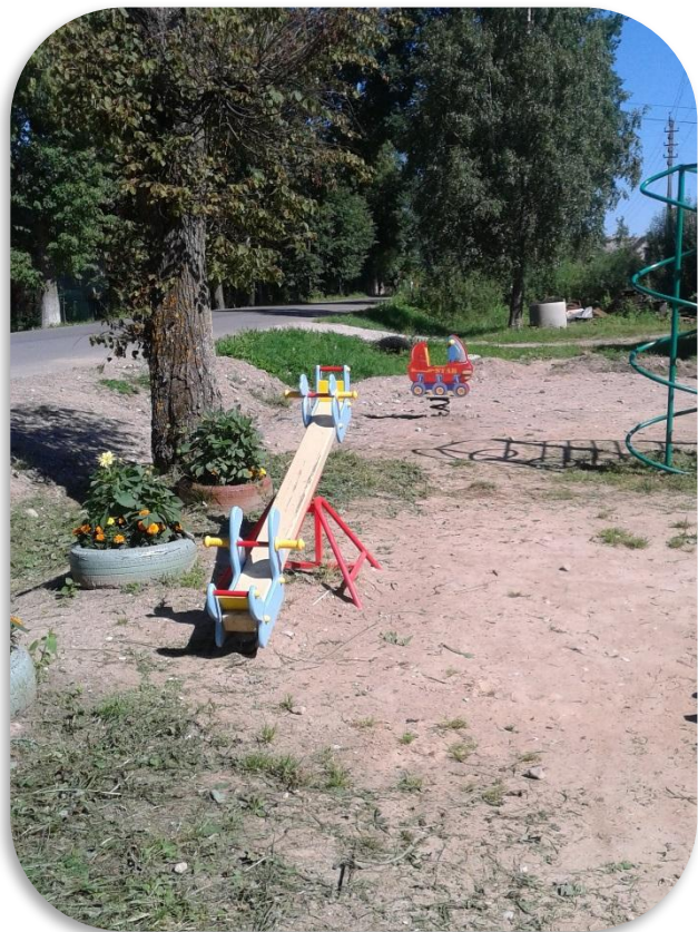
установка качалки на пружине и качалки-балансира ТОО «Некохово-Вешки»