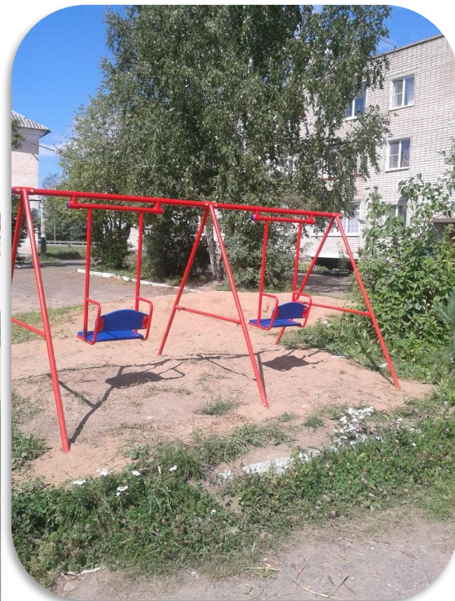
установка детского игрового комплекса ТОО «Заезд ДРП»