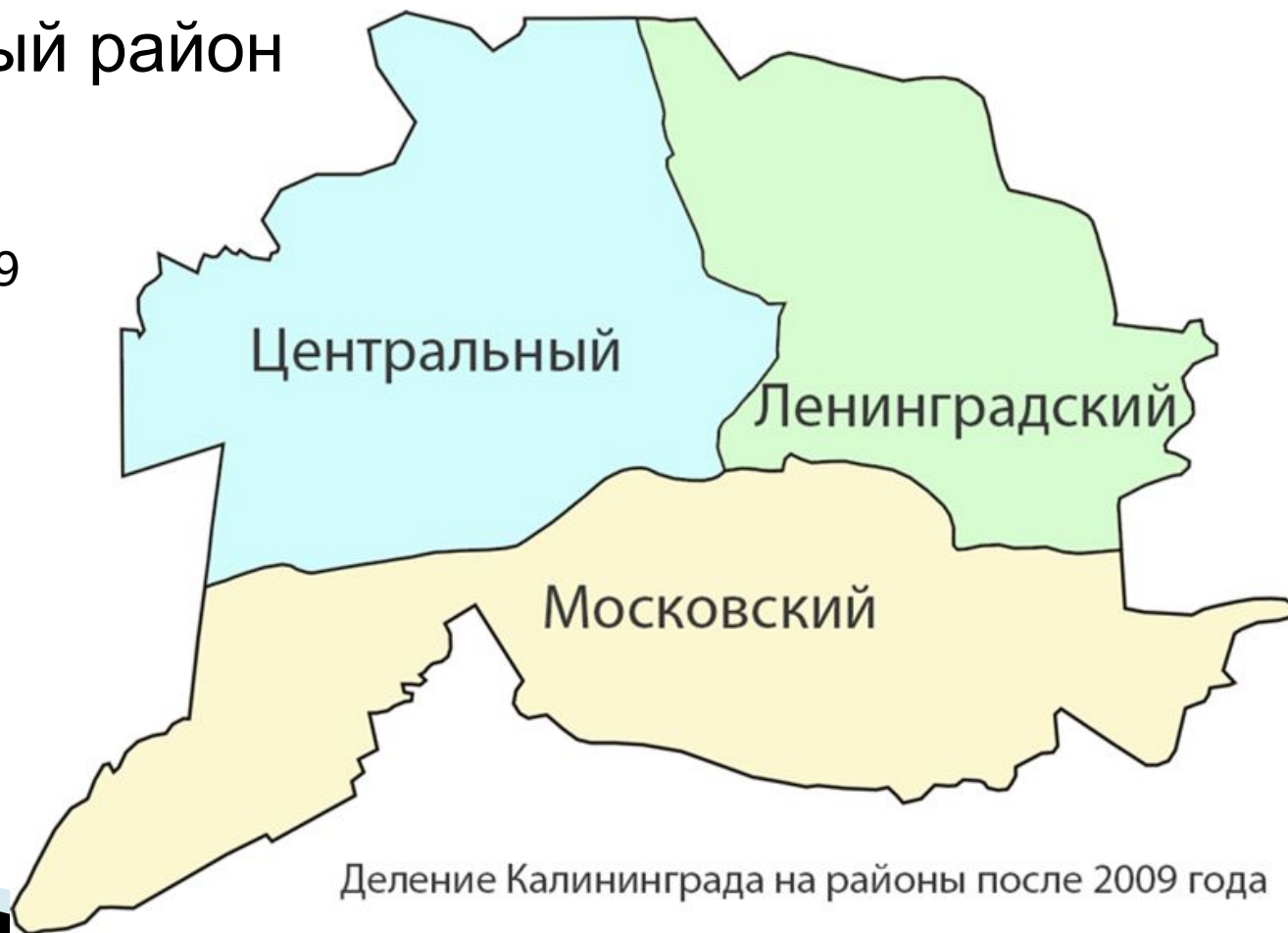
Деление Калининграда на районы после 2009 года

До 29 июня До 29 июня 2009 года До 29 июня 2009 года город делился на пять административных районов. Кроме имеющихся, существовало ещё два: Балтийский и Октябрьский