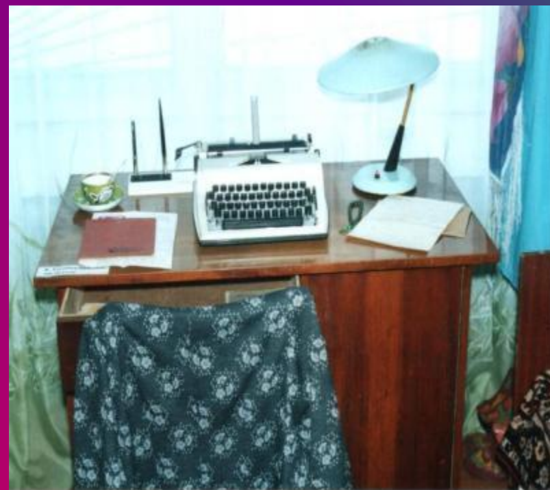
Язучының эш өстәле