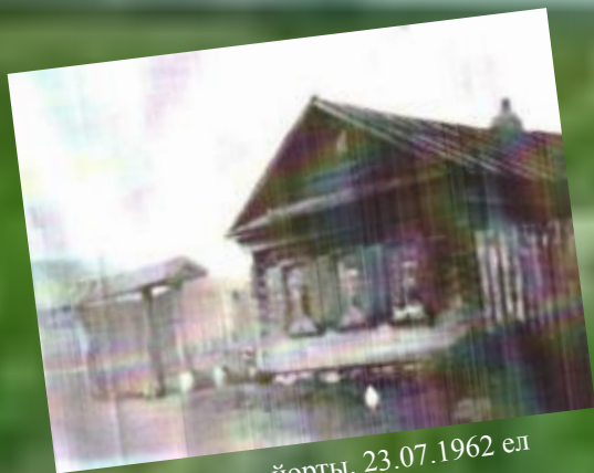
Тимбиковлар йорты. 23.07.1962 ел