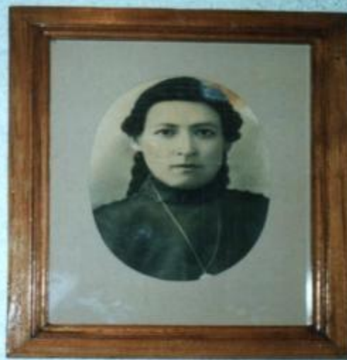
Сания Тимбикова 1910 жылғы суреті