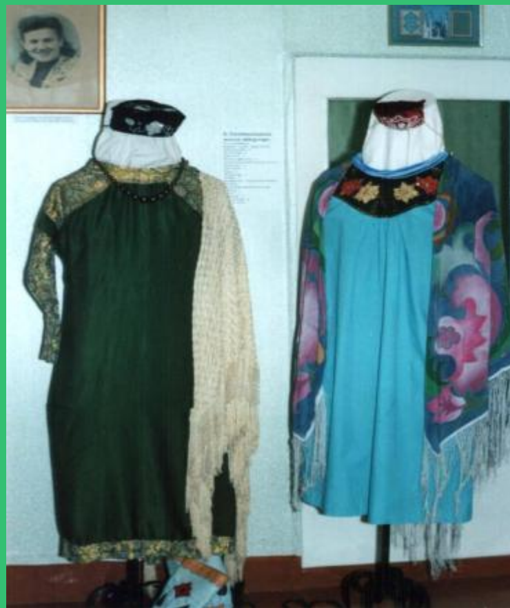
Язучының милли киёмнәре