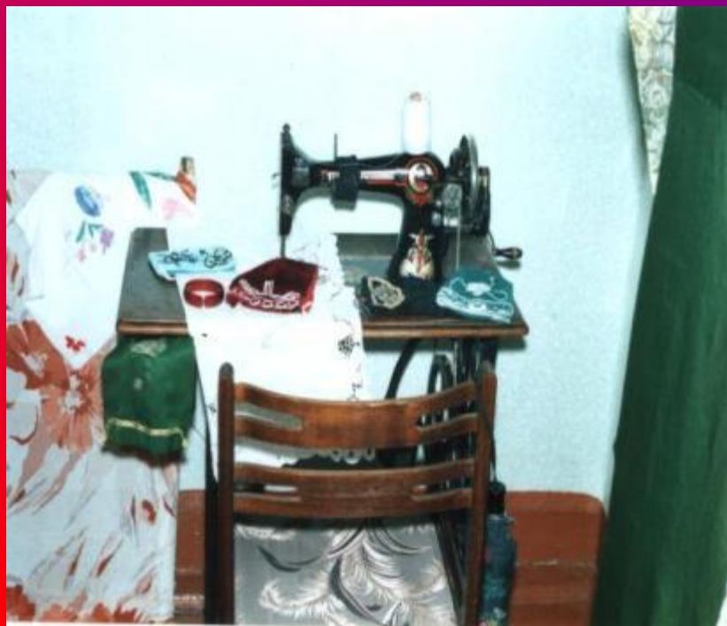
Әнисеннән калган тегү машинасы