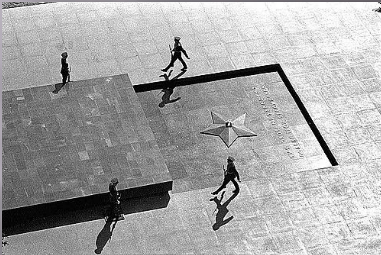
Смена почетного караула у Могилы Неизвестного солдата, Москва, 8 мая 1967 года.