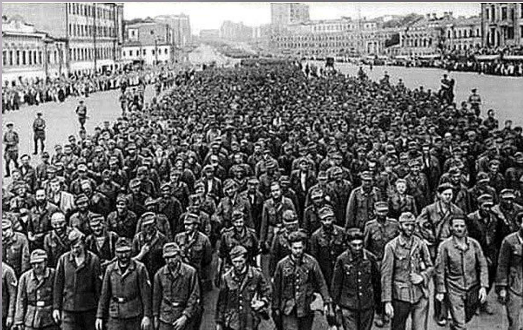
«Парад побежденных». Марш пленных немцев по Москве 17 июля 1944 года