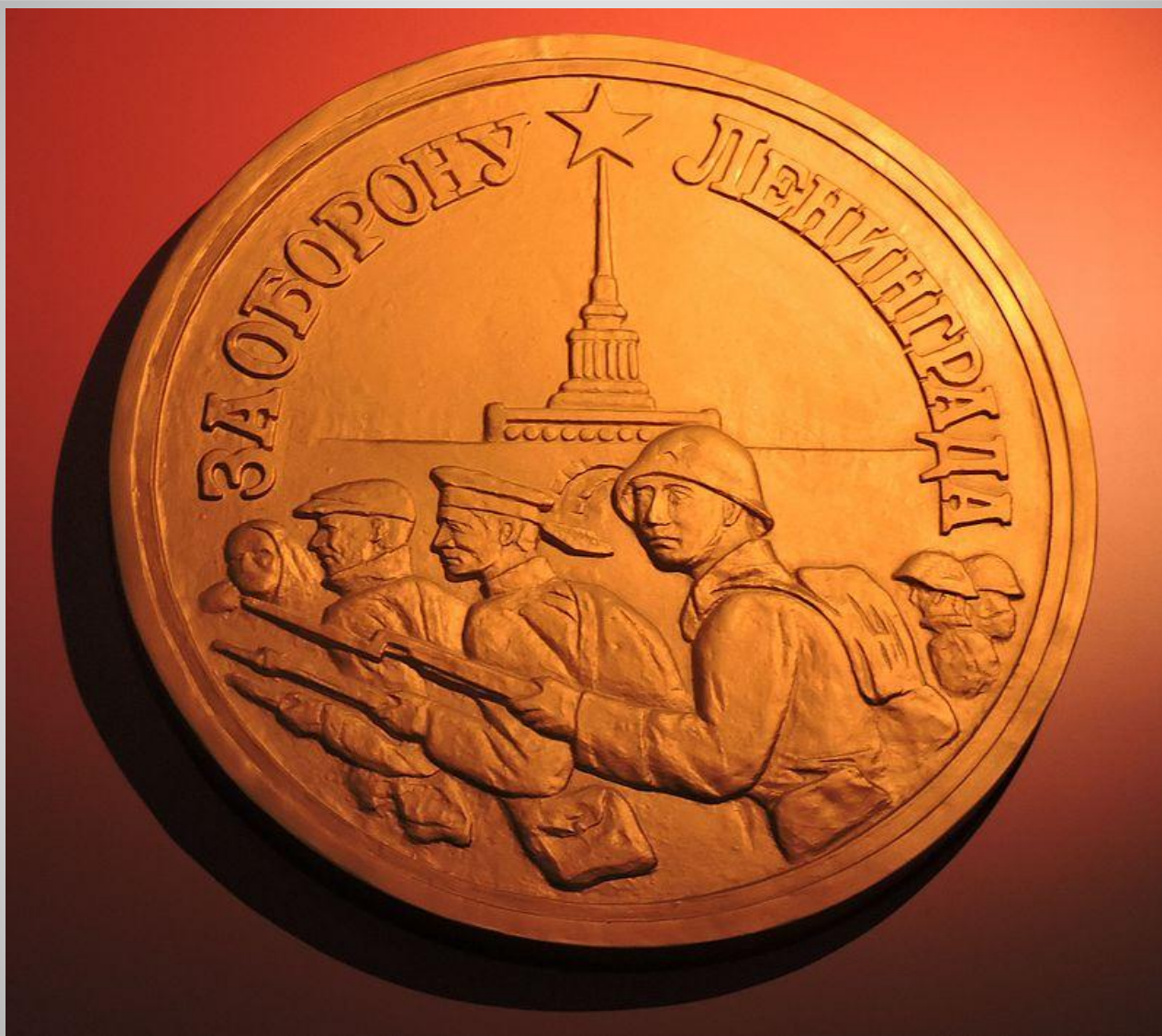
Медаль «За оборону Ленинграда» в музейном павильоне