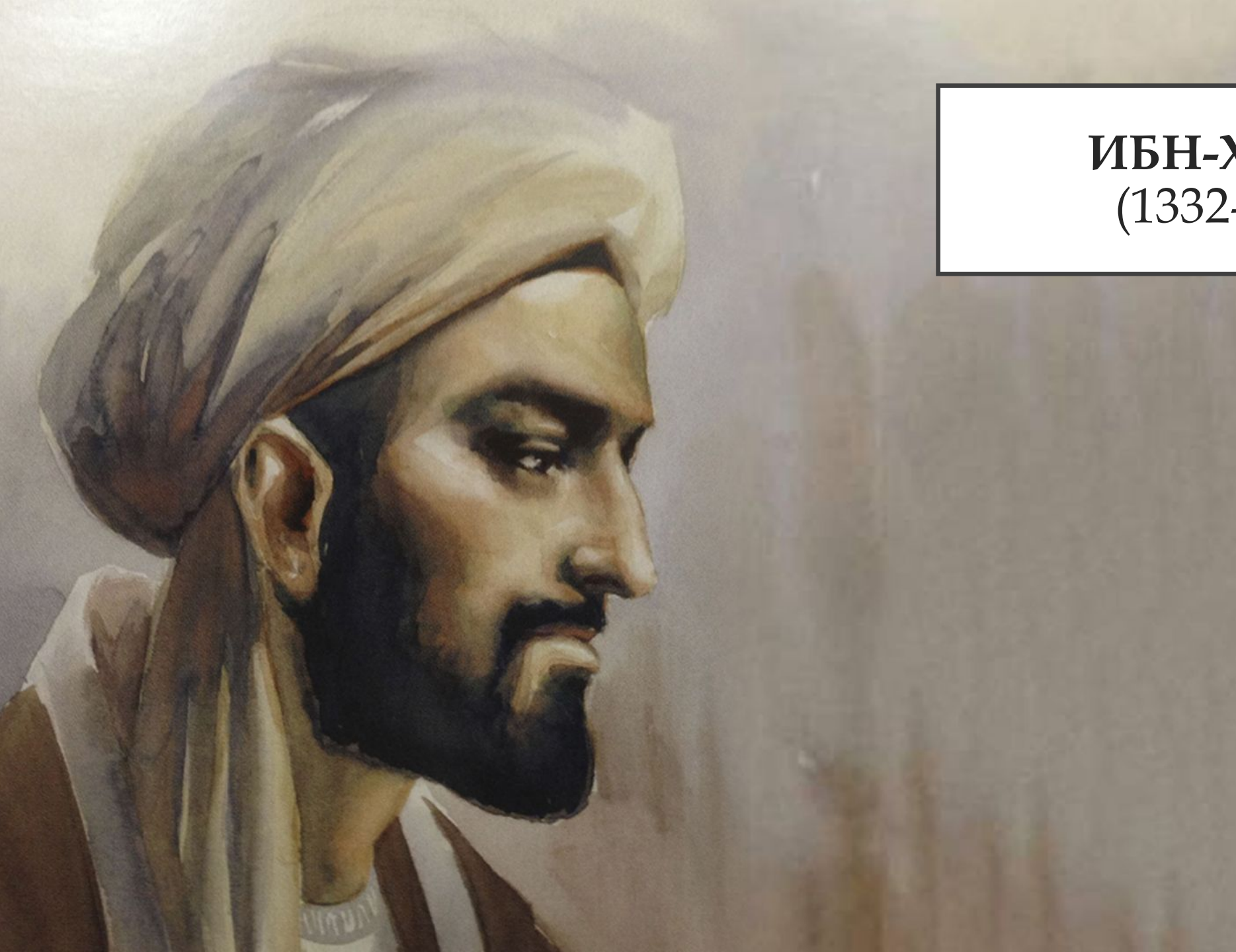
ИБН-ХАЛЬДУН (1332–1406 ГГ.)