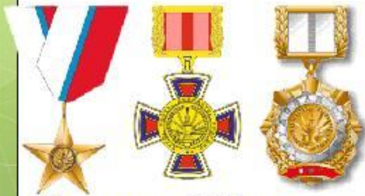
Награды РФ за труд