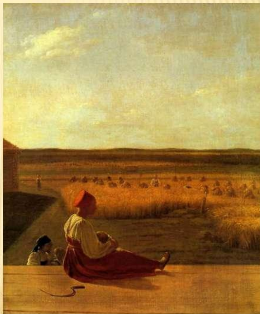
А.Венецианов «На жатве»