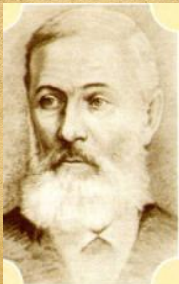
Отец — Павел Егорович Чехов. Рис. С.М. Чехова