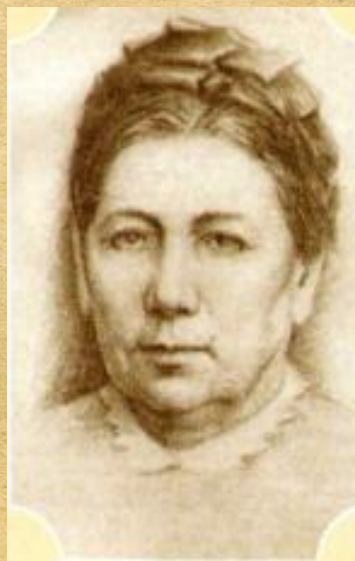
Мать — Евгения Яковлевна Чехова. Рис. С.М. Чехова