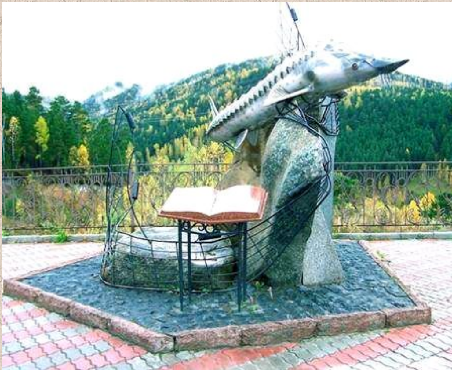
Красноярск. Памятник повести В. Астафьева «Царь-рыба».