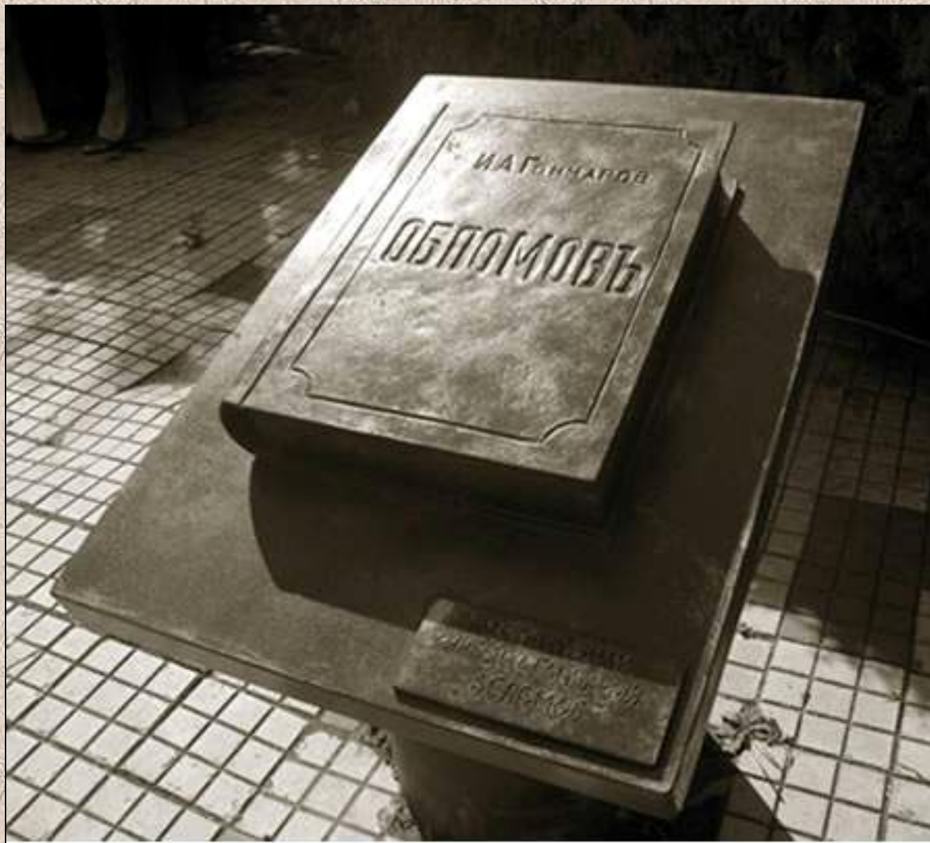
Россия. Симбирск. Памятник роману Гончарова “Обломов”.