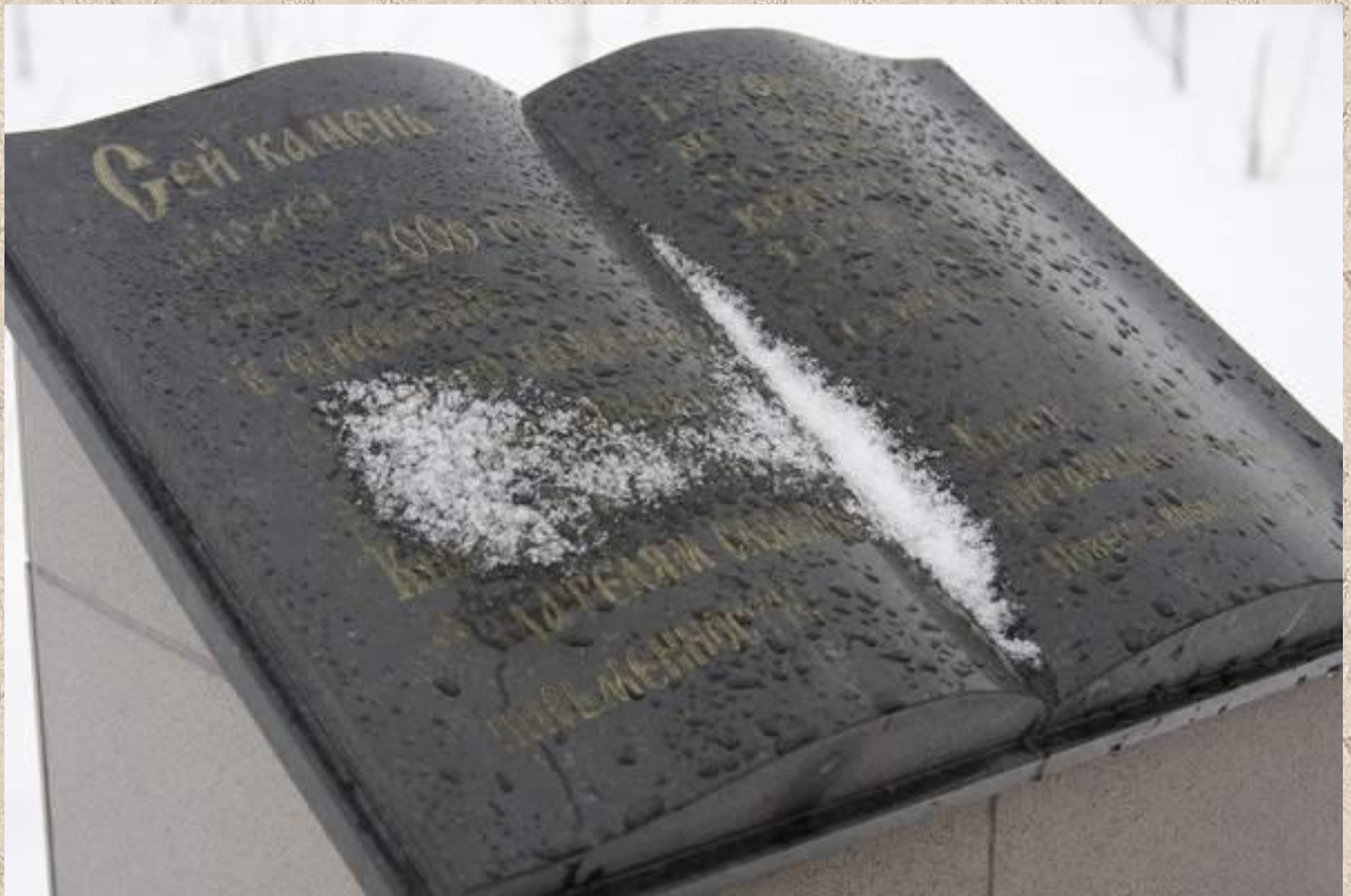
Россия. Сургут. Памятник книге.