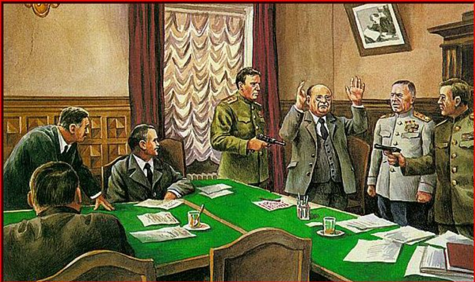
Арест Л.Берии на заседании Президиума ЦК КПСС Иллюстрация из "Энциклопедии для детей" (с)Соруригит "Аванта+"