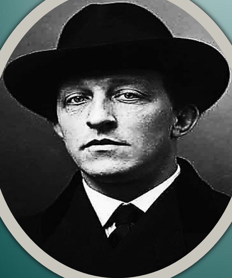
А.А. БЛОК, 1880-1921

И странной близостью закованный, смотрю за темную вуаль, И вижу берег очарованный, И очарованную даль...