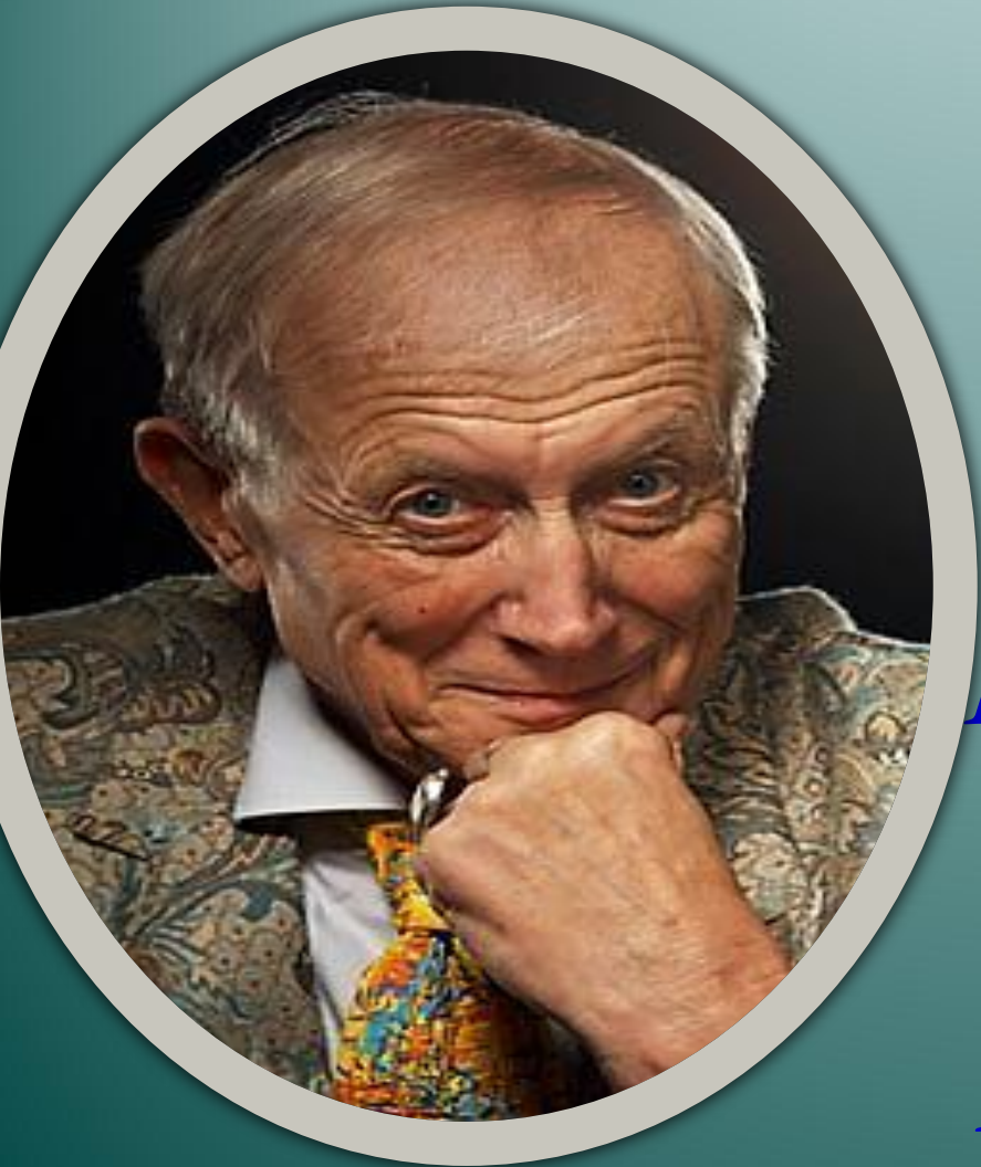
Е.А. ЕВТУШЕНКО, 1933