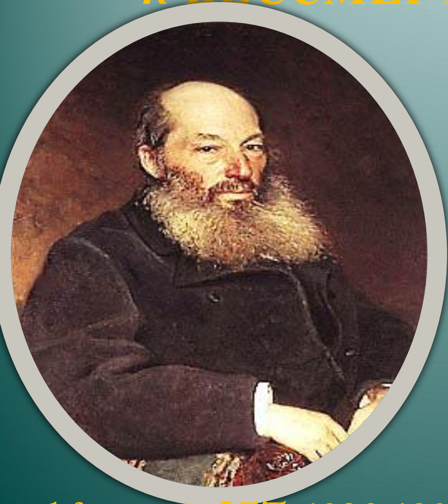
Афанасий ФЕТ, 1820-1892

Если ты любишь, как я, бесконечно, Если живешь ты любовью и дышишь, Руку на грудь положи мне беспечно: Сердца биенья под нею услышишь.