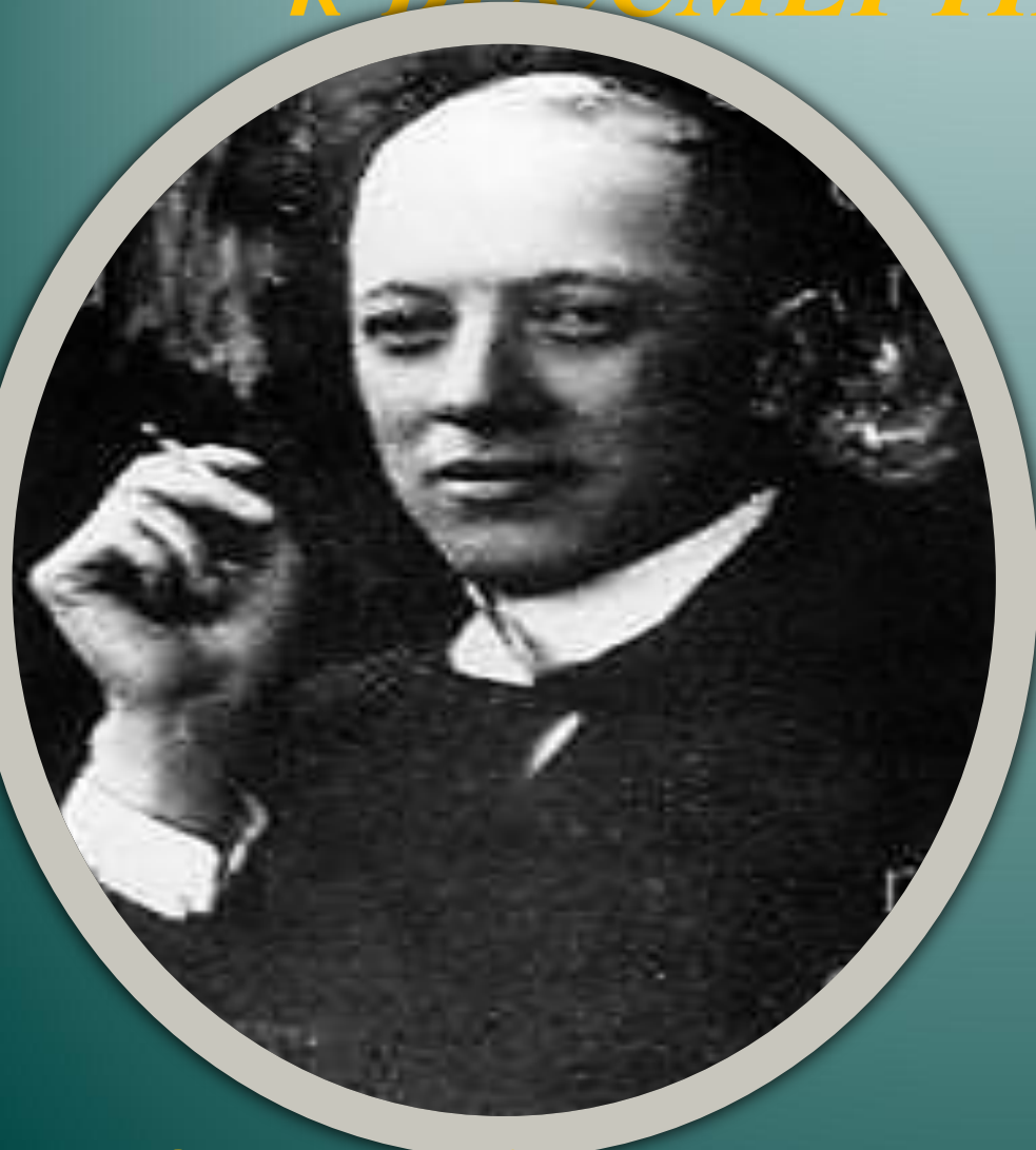
Н.С. ГУМИЛЕВ, 1886-1921

Вот я один в вечерний тихий час, Я буду думать лишь о вас, о вас. Возьмусь за книгу, но прочту: "она", И вновь душа пьяна и сметена...