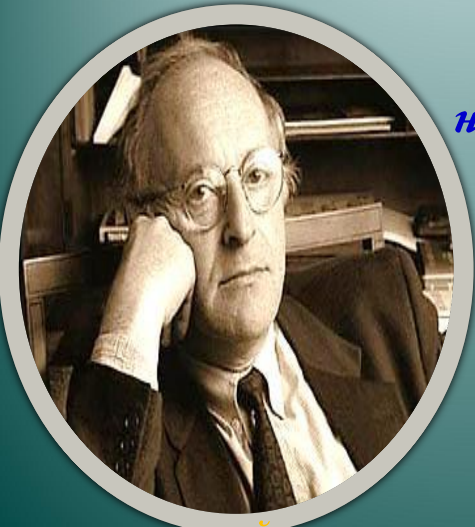
И.А. БРОДСКИЙ, 1940-1996

Я дважды пробуждался этой ночью и брел к окну, и фонари в окне, обрывок фразы, сказанной во сне, сводя на нет, подобно многоточью не приносили утешенья мне...