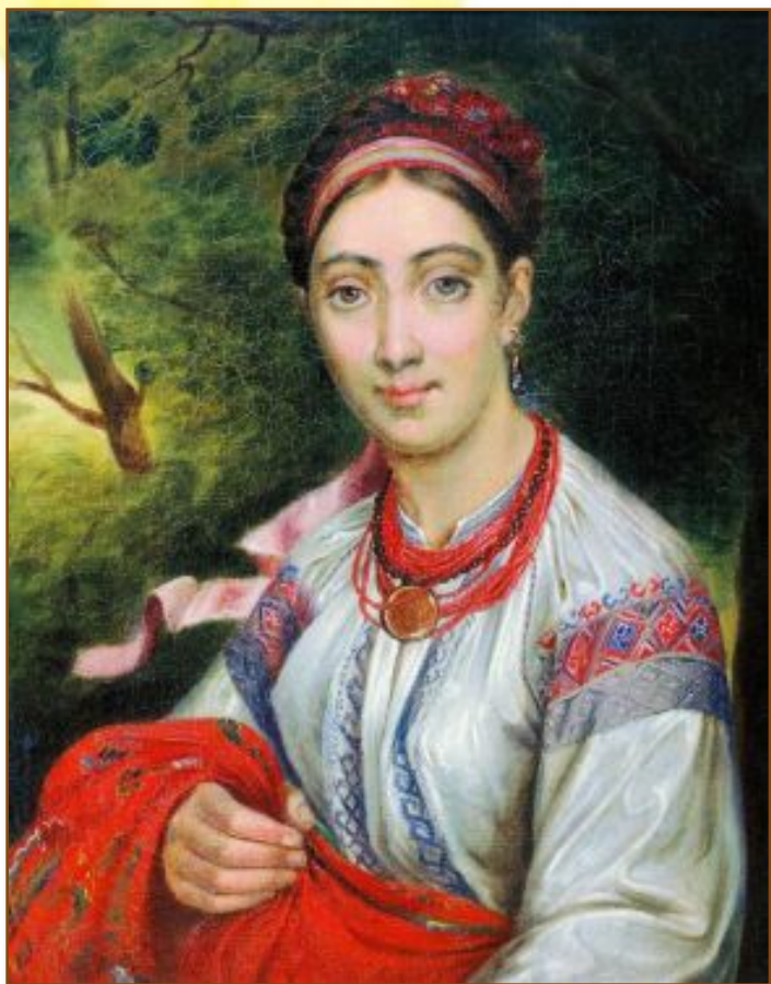
Василь Тропінін. «Українка в пейзажі»