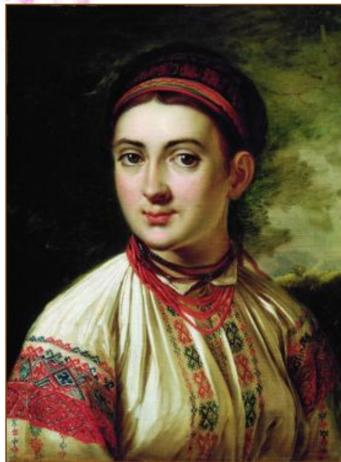
Василь Тропінін. «Українська дівчина з Поділля»