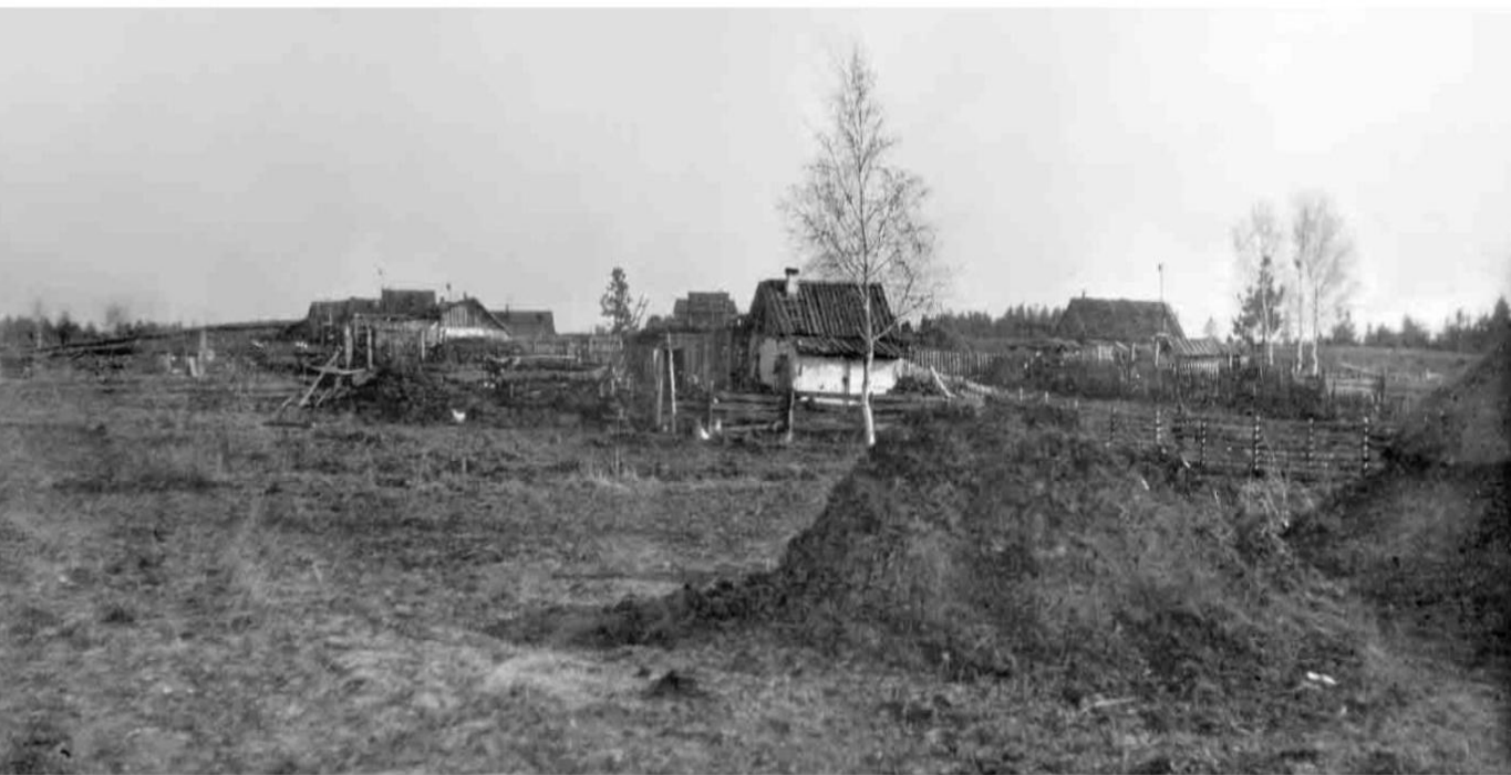
Послевоенное село. Малогобаритные избы и землянки. Станция Озерки. Тальменский район. 1940-е гг. Архив Т.К Щегловой.

Фрагмент разреженной застройки села Красные Орлы (Чарышский район) в послевоенное время с сохранившимися срубными избами и пятистенками и большими огородами.