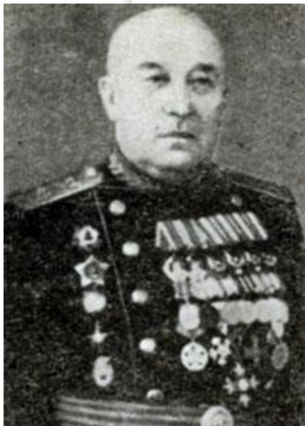
Генерал – лейтенант Горшков С. И.