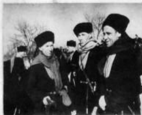
КАЗАКИ-БУДЕНОВЦЫ, УЧАСТНИКИ РАЗГРОМА НЕМЦЕВ ПОД РОСТОВОМ В 1918 Г.