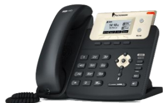
Yealink SIP-T21 E2

Бюджетная модель для малого и среднего бизнеса