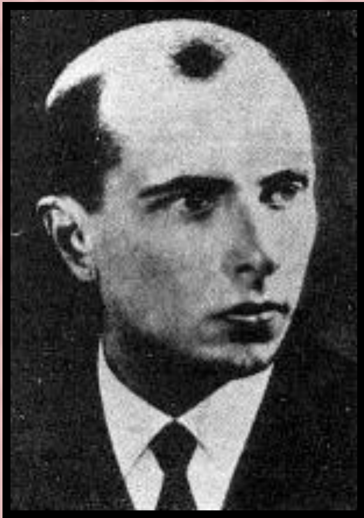
С.Бандера-лидер украинских националистов.

Однако «демократический импульс» войны оживил националистические настроения и течения.