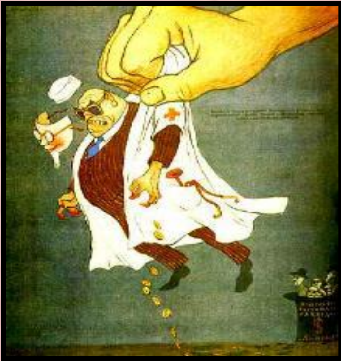
Разоблачение «врачей-убийц». Плакат 1952 г.

В начале 50-х гг. сфабрикованы «мингрельское дело» (1951-1952гг) и «дело врачей» (январь 1953г).