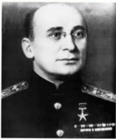
Куратор атомного проекта СССР Л.П. Берия