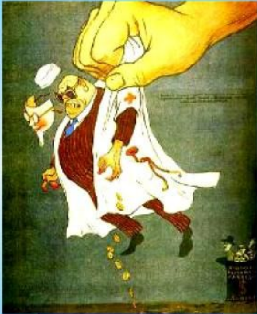
Разоблачение «врачей-убийц». Плакат 1952 г.

В конце 1952 г. было сфабриковано «мингрельское дело». Последним из готовившихся процессов стало «дело врачей», обвиненных в неправильном лечении руководителей Советского государства. Последовали многочисленные аресты и только смерть Сталина спасла многих от лагерей или расстрела.