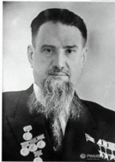
Главный научный руководи- тель атомной проблемы И.В. Курчатов