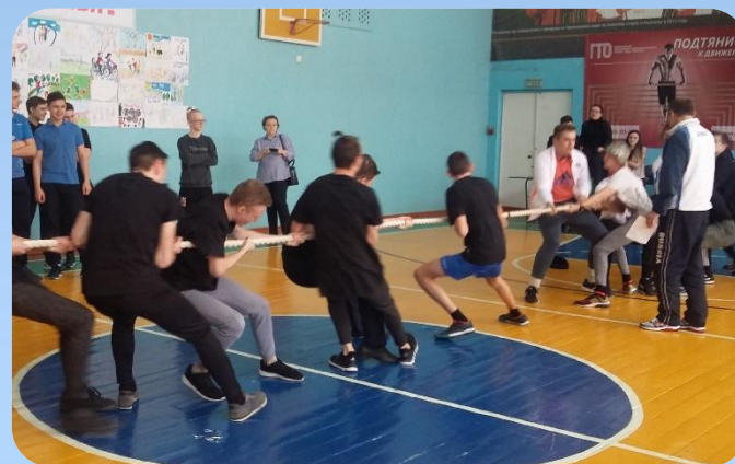
Праздник «Богатырская сила»