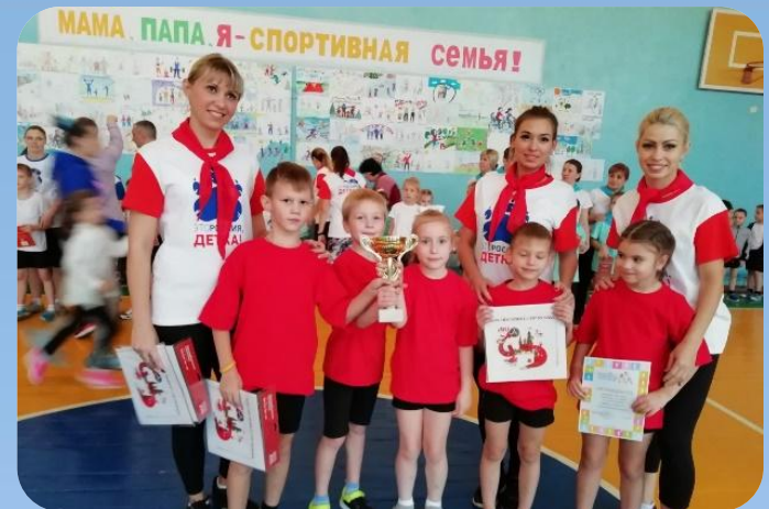
Соревнования «Детки +предки»