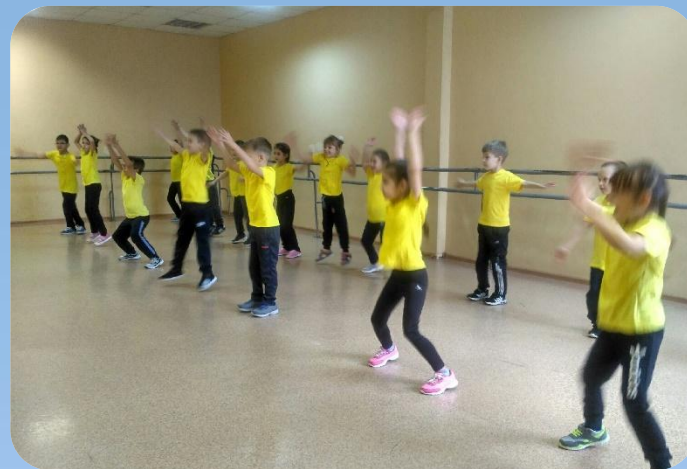
Малый спортивный зал