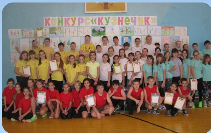
Конкурс по скиппингу «Кузнечик»