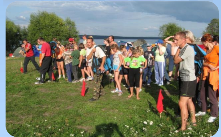
Дни здоровья «На природу всей семьей!»