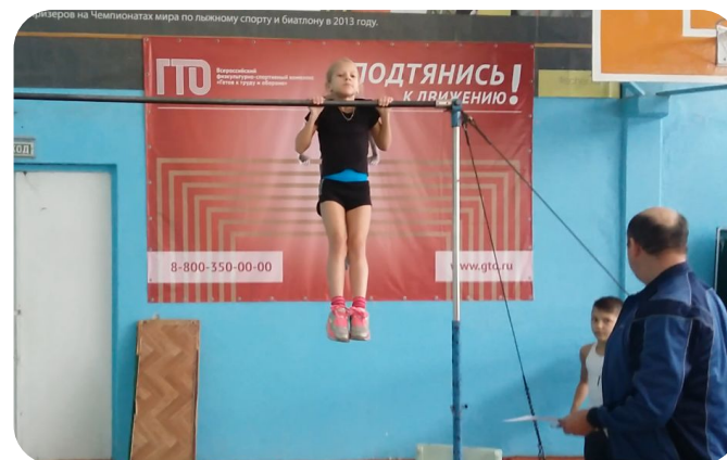
Акция РДШ «Сила РДШ»