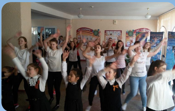
Флеш-моб к Всемирному Дню Здоровья