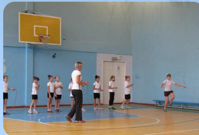
Большой спортивный зал