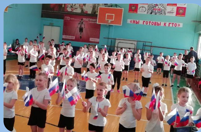
Праздник «Мы готовы к ГТО»