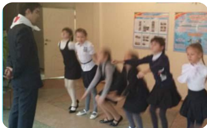
Акция РДШ «Приседай на здоровье!»