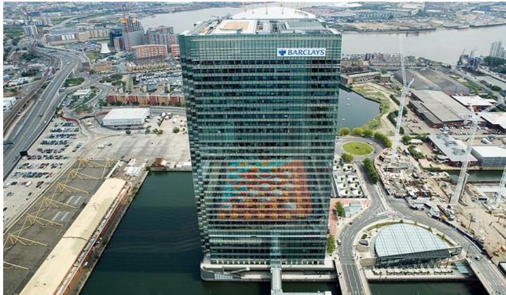
Barclays - Крупнейший банк Великобритании