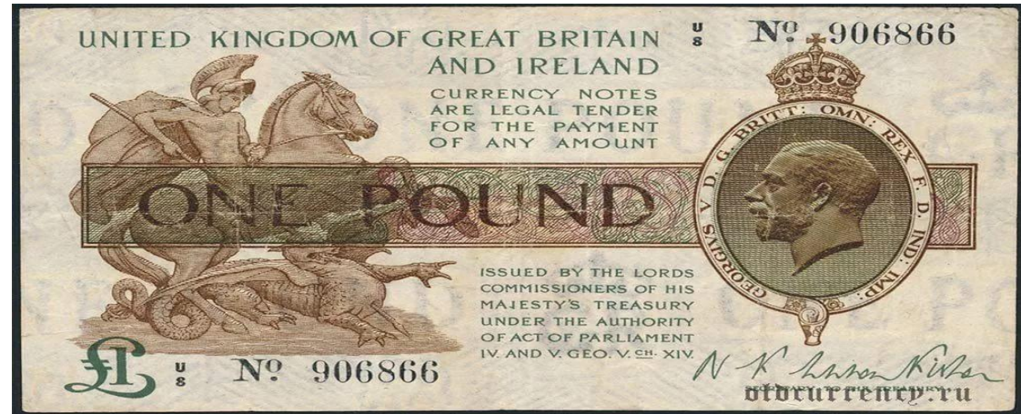
1 ф.ст. 1919 год