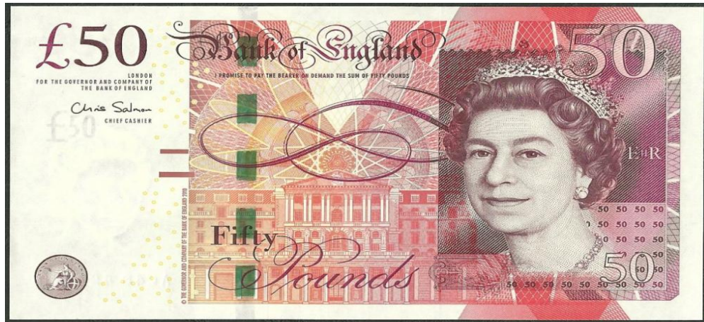
50 фунтов стерлингов современного образца